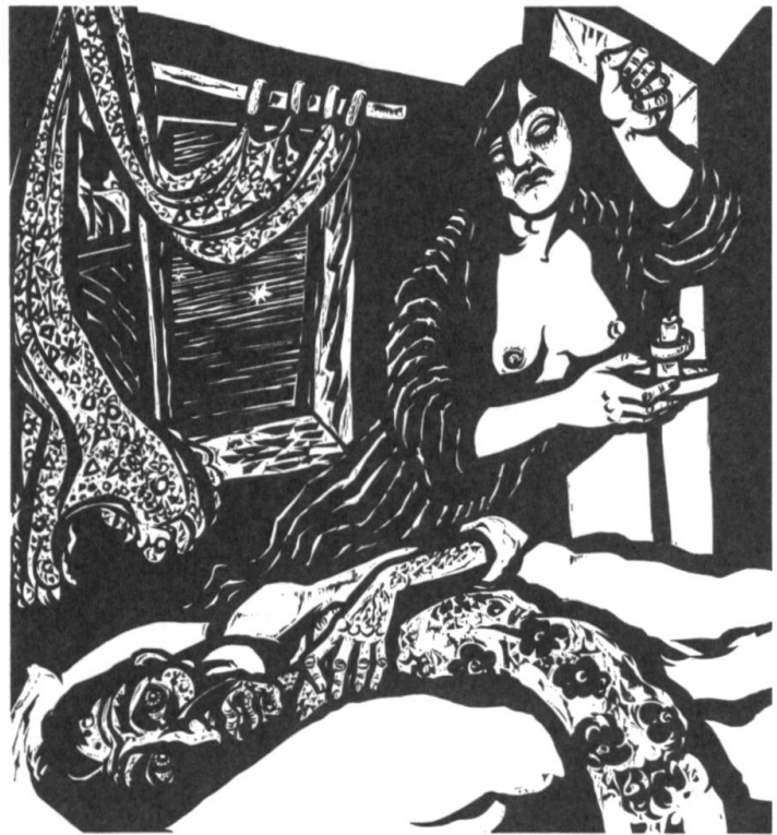
«Hiob wird von seiner Frau verlassen.» [10]

Als weitere Auseinandersetzung mit dem Krieg in Jugoslawien entsteht 1996 ein Leporello mit 5 Holzschnitten: «In Bosnien hat der Tod getanzt» im kleineren Format 10 × 16 cm und einer kurzen Chronologie der Ereignisse in Bosnien [14].