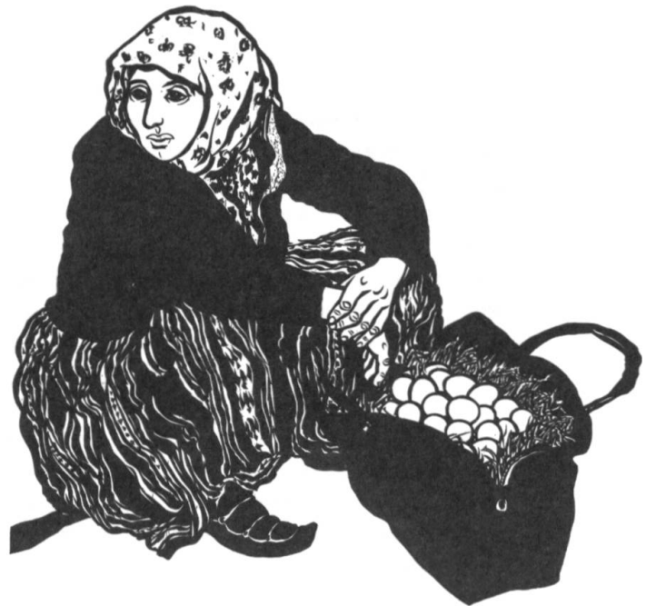
Auf dem Markt von Prizren. 1993. 37×36 cm.