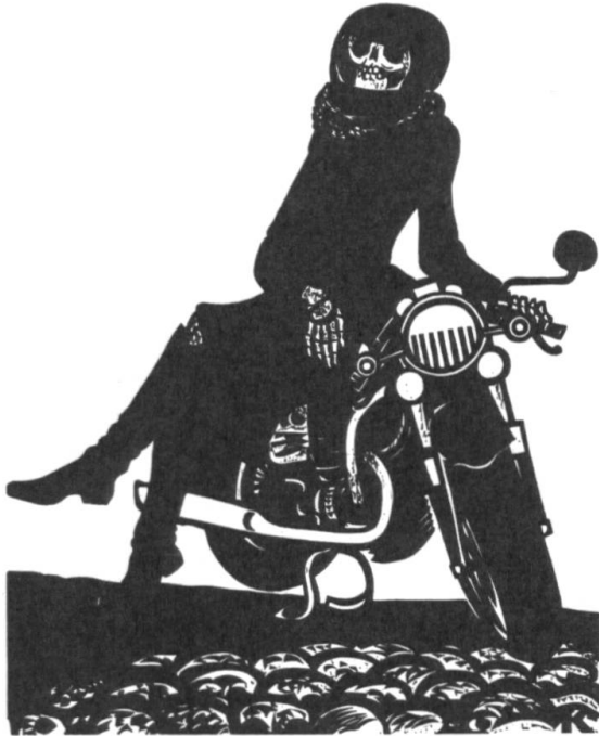
Heinz Keller: «Mich wundert, dass ich fröhlich bin.» [7]

1981, 1993 und 2008 erscheinen drei Werkverzeichnisse [5, 12, 19], die umfassend Leben und Werk des Künstlers dokumentieren.