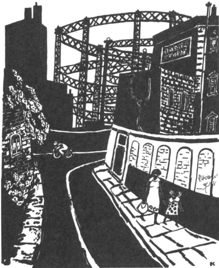
Zerfallendes Gemäuer und rostende Gerippe. London 2008. 34×42 cm.

Frühe Reisen und Studienaufenthalte führen ihn in den Süden nach Lipari und Stromboli und in den Norden in die Hafenstadt Hamburg. In seiner ersten Einzelausstellung in Winterthur zeigt er 1958 Lithografien, Holzschnitte und Zeichnungen. Es folgen Einladungen zu internationalen Ausstellungen in Italien, Jugoslawien und in der Schweiz. In den Sechzigerjahren tritt das Lithografieren und Aquarellieren etwas in den Hintergrund, und 1962 gibt er seinen Brotberuf ganz auf und arbeitet fortan als selbständiger Holzschneider und Maler. 1960 tritt er der Internationalen Vereinigung der Holzschneider Xylon bei und gründet mit zwei Kollegen die gleichnamige Zeitschrift, deren erste zehn Ausgaben sie als Herausgeber und Drucker betreuen.