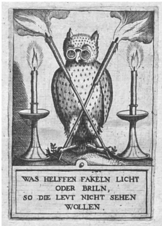
Die im Exemplar der ETH-Bibliothek fehlende Tafel «Die Eule», reproduziert nach dem Exemplar der Stiftung der Werke von C. G. Jung, Zürich. Kupferstich, 6,7 × 9,6 cm.