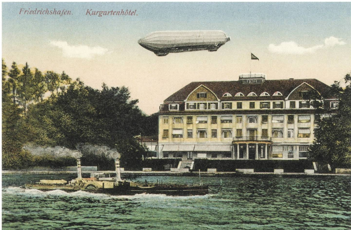
Kurgartenhotel Friedrichshafen. Historische Ansichtskarte.

Sprungbrett in die Schweiz. Hatte sich die Reise dorthin im «Zauberberg» aus norddeutscher Perspektive noch als schieres Abenteuer ausgenommen – «durch mehrerer Herren Länder, bergauf und bergab, von der süddeutschen Hochebene hinunter zum Gestade des Schwäbischen Meeres und zu Schiff über seine springenden Wellen hin, dahin über Schlünde, die früher für unergründlich galten» 12 –, wurde die Fahrt über den Bodensee in die Schweiz nach Verlegung des Lebensmittelpunkts nach Bayern bald zu einer lieben Gewohnheit. «Die Reise zu Ihnen» – gemeint sind die Schweizer – «ist kein Abenteuer», heißt es nun im «Brief über die Schweiz». «Bequem ist Lindau erreicht; man schiffte übers Schwäbische Meer und setzt den Fuß auf Ihren redlichen Grund.» 13