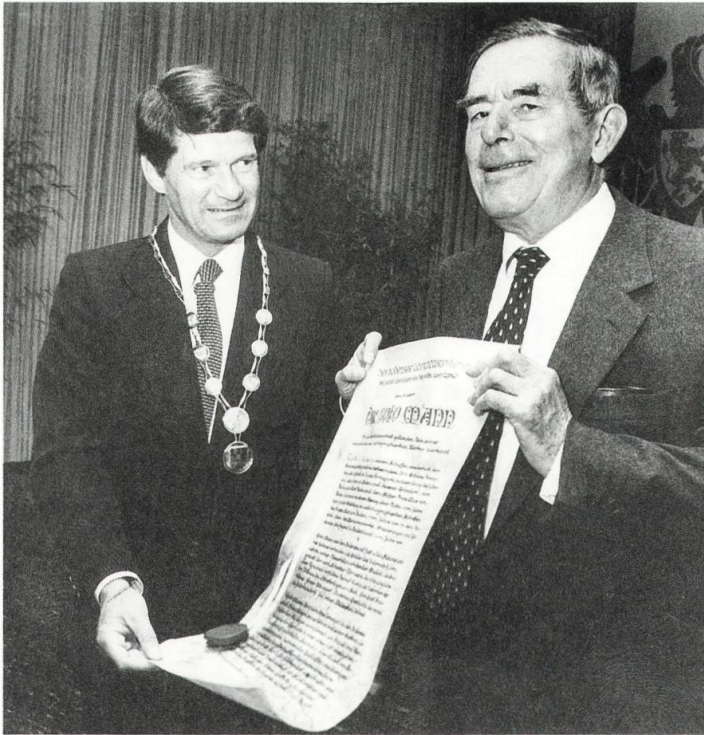
Verleihung des Bodensee-Literaturpreises der Stadt Überlingen 1987 an Golo Mann.

Umfang schließlich auf 600 Manuskriptseiten. «Ganz nett für einen Anfänger», kommentierte Mann seine Leistung, «wenn man die Masse für Qualität nimmt.» 33