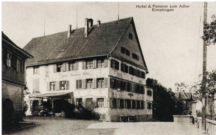
Das Hotel Adler in Ermatingen.