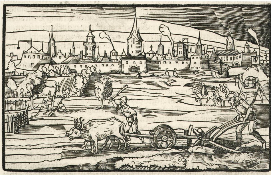
PV III, 2