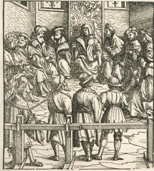
PV II, 1