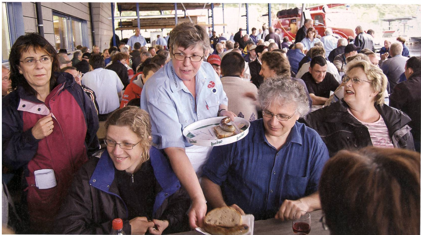
Zahlreiche Besucherinnen und Besucher waren im Sternmarsch nach Lenzburg gekommen.

Weil der Staufner Wald an den Lenzia-Forst grenzt, sind die Voraussetzungen für eine gemeinsame Beförderung ideal. Die Fläche der Ortsbürgerwalds Lenzia hat sich damit von 1000 auf 1097 Hektaren oder um zehn Prozent, die Forstrevierfläche von 1026 auf 1141 Hektaren (elf Prozent) vergrössert. Neu sind im Staufner Forst 15 Hektaren Privatwald (insgesamt 41 Hektaren) zu betreuen. Für den Staufner Wald wird ein neuer Betriebsplan erstellt. Stadtoberförster Frank Haemmerli rechnet mit einer Jahresnutzung von 250 Silven Staufner Holz. Mit dem Zusammenschluss ist Lenzia eines der grössten Reviere im Kanton geworden.