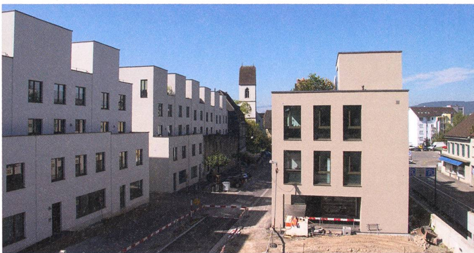
Die Fassade zur Promenade mit dem Solitär (rechts).

Die vorbildliche architektonische Umsetzung der gewonnenen Erkenntnisse emphatisiert die städtebaulichen Absichten dadurch, dass die Morphologie und die Materialisierung der Gebäude für die Altstadt Lenzburg im ganzen wie im Detail den im Entwurf aufgebauten Prinzipien voll umfänglich entsprechen».