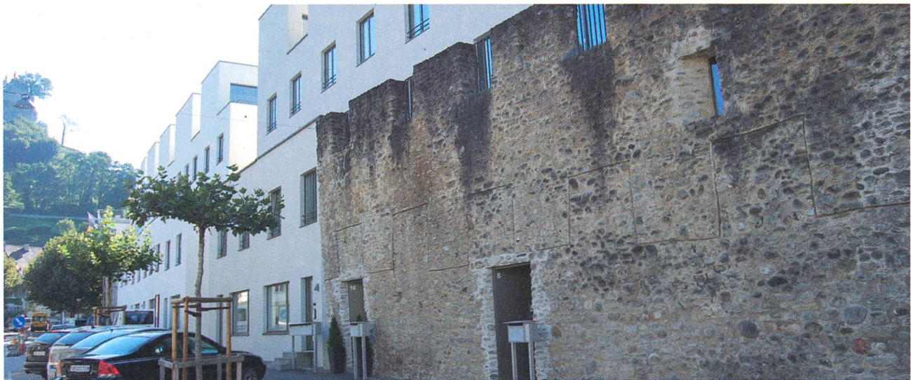
Die Symbiose von sanierter Stadtmauer und moderner Überbauung, Situation ab 2012.