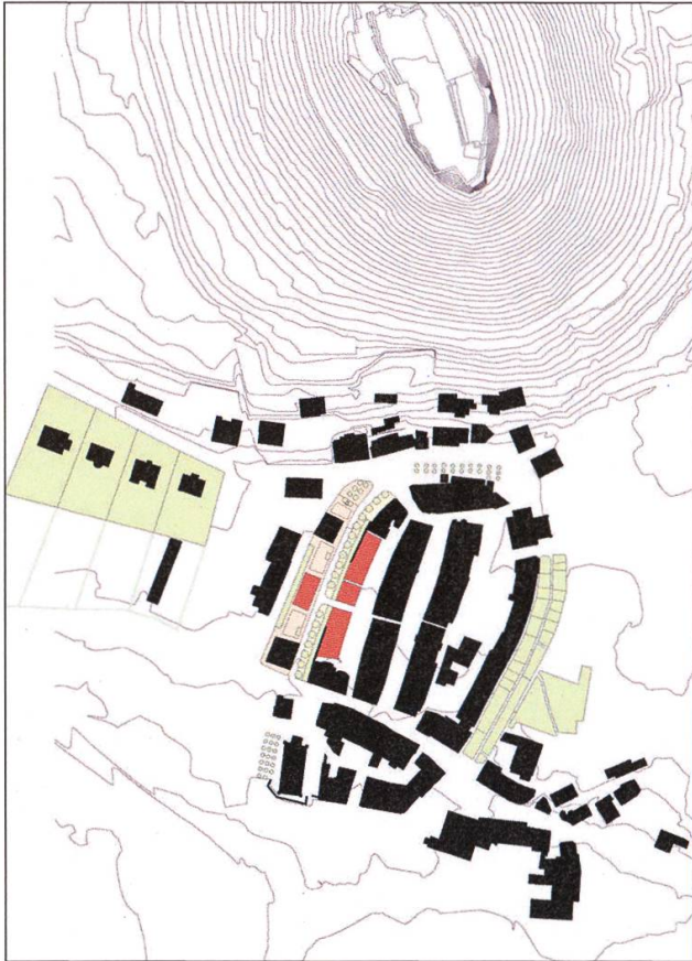
Der Konzeptplan für die neue Häuserzeile (rot).

nungskredit für die Erarbeitung eines Gestaltungsplanes sprach. Dieser Gestaltungsplan konnte aber erst am 20. Dezember 1995 beschlossen werden, nachdem in der Zwischenzeit über das Schicksal der Stadtmauer befunden wurde.