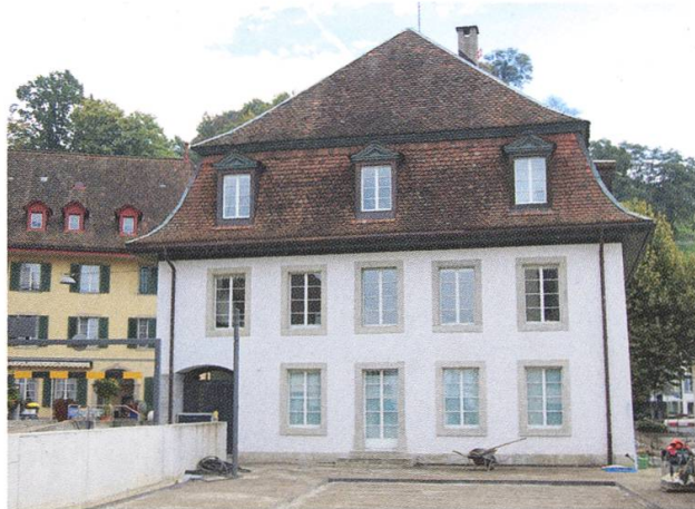
Das Försterhaus, von Anbauten befreit.

Ein wichtiges Ziel für die Überbauung Eisengasse war es, eine hohe, den heutigen Bedürfnissen entsprechende Wohnquali-