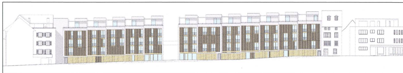
Die Überbauung Sandweg-Eisengasse im Schnitt und die Fassaden zu Promenade und Eisengasse.