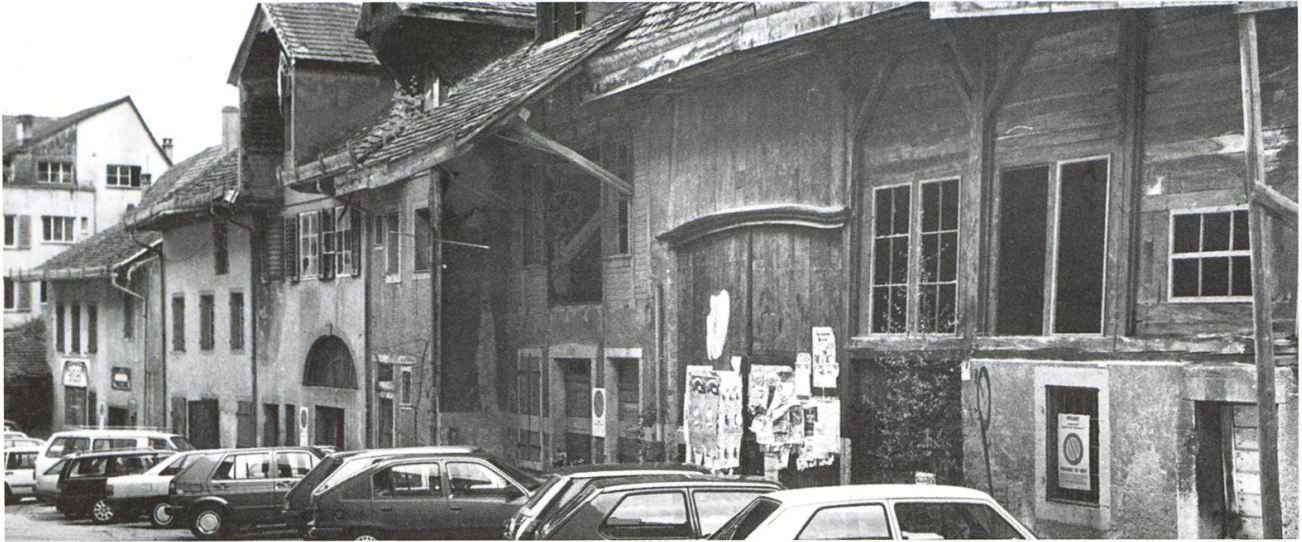
Der jahrzehntelange «Schandfleck», die zerfallenden Häuser an der Eisengasse, wurden 1994/95 abgebrochen.