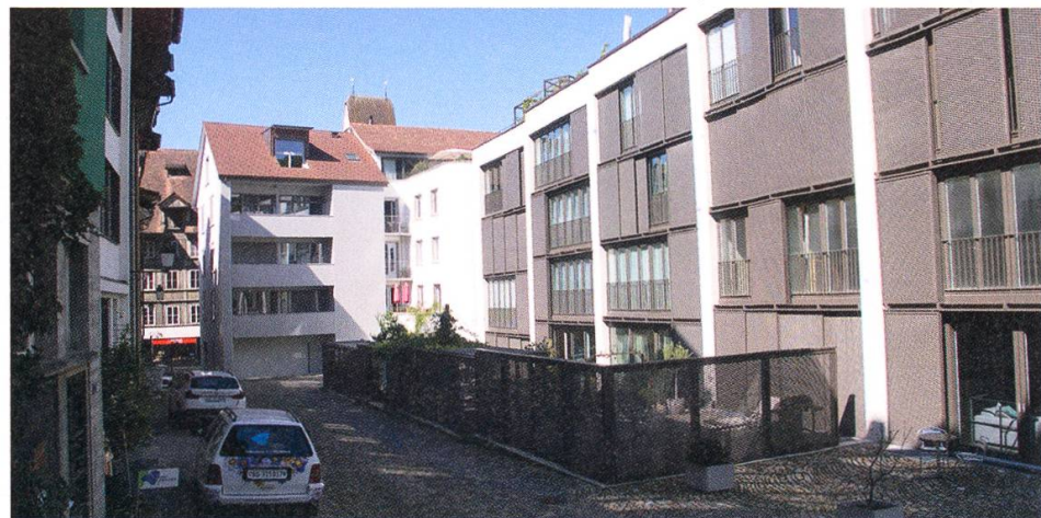
Die Fassade zur Eisengasse mit dem Neubau an der Kirchgasse (unten).