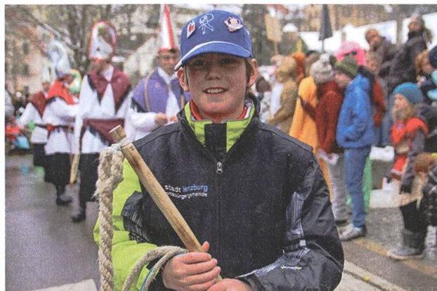
Der Weltmeister 2015, Michel Baumann.

Die umtriebigen Lenzburger Chlausklöpfer beschränken sich längst nicht mehr auf die traditionellen heimischen Wettbewerbe, sondern treten regelmässig an Anlässen im In- und Ausland auf. So hatten sie 2006 am Vortag des Zürcher Sechseläutens einen Auftritt auf dem Pestalozziplatz. 2008 waren sie Bestandteil des Rahmenprogramms am Eidg. Jodlerfest in Aarau. 2011 traten sie am Fernsehen am «SF bi de Lüüt» auf.