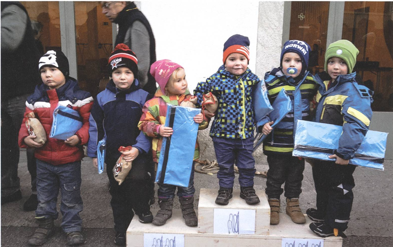
Der Nachwuchs durfte zur Freude des Publikums seine ersten Chlöpfversuche wagen.