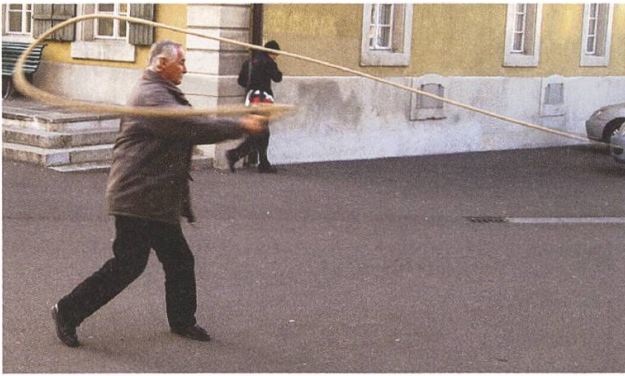
Der Trick mit dem Zwick führt zum Überschallknall, Übung macht den Meister.

gativ aus. Takt und Taktik sind wichtig, und auch der Stil spielt eine Rolle, um zu punkten. Zur «hohen Schule» gehören meist zum Abschluss die Gruppen-Auftritte der erfahrenen Klöpfer.