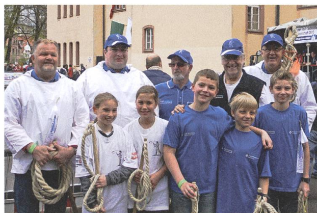
Die Lenzburger Chlausklöpfer sahten an der Karbatschen-Goassln-Schnöller-WM 2013 ab. RS

2015 waren sie an der Eröffnungsfeier einer «Allianz-Olympiade» auf der offenen Rennbahn in Oerlikon dabei. 2016 zogen sie am Umzug an der Olma in St. Gallen mit. Im Ausland besuchten sie mit grösstem Erfolg 2013 die 5. Karbatschen-Goassln-Schnöller-Weltmeisterschaft in Villingen-Schwenningen und 2015 die Schneller-Weltmeisterschaft in Weingarten bei Ravensburg (Oberschwaben-Allgäu), ein Klöpfwettbewerb mit den Kategorien Kurzstielige Karbatsche, Langstielige Karbatsche (Goasl, Geissle) und Flexible Goasl (Fuhrmannspeitsche). Entsprechend sind die Chlausklöpfer auch immer wieder in der Presse, am Radio, im Fernsehen, bei volkstümlichem Brauchtum, an Schulen, bei Kirchgemeinden usw. präsent. Wahhaftig ein Brauchtum, das lebt.