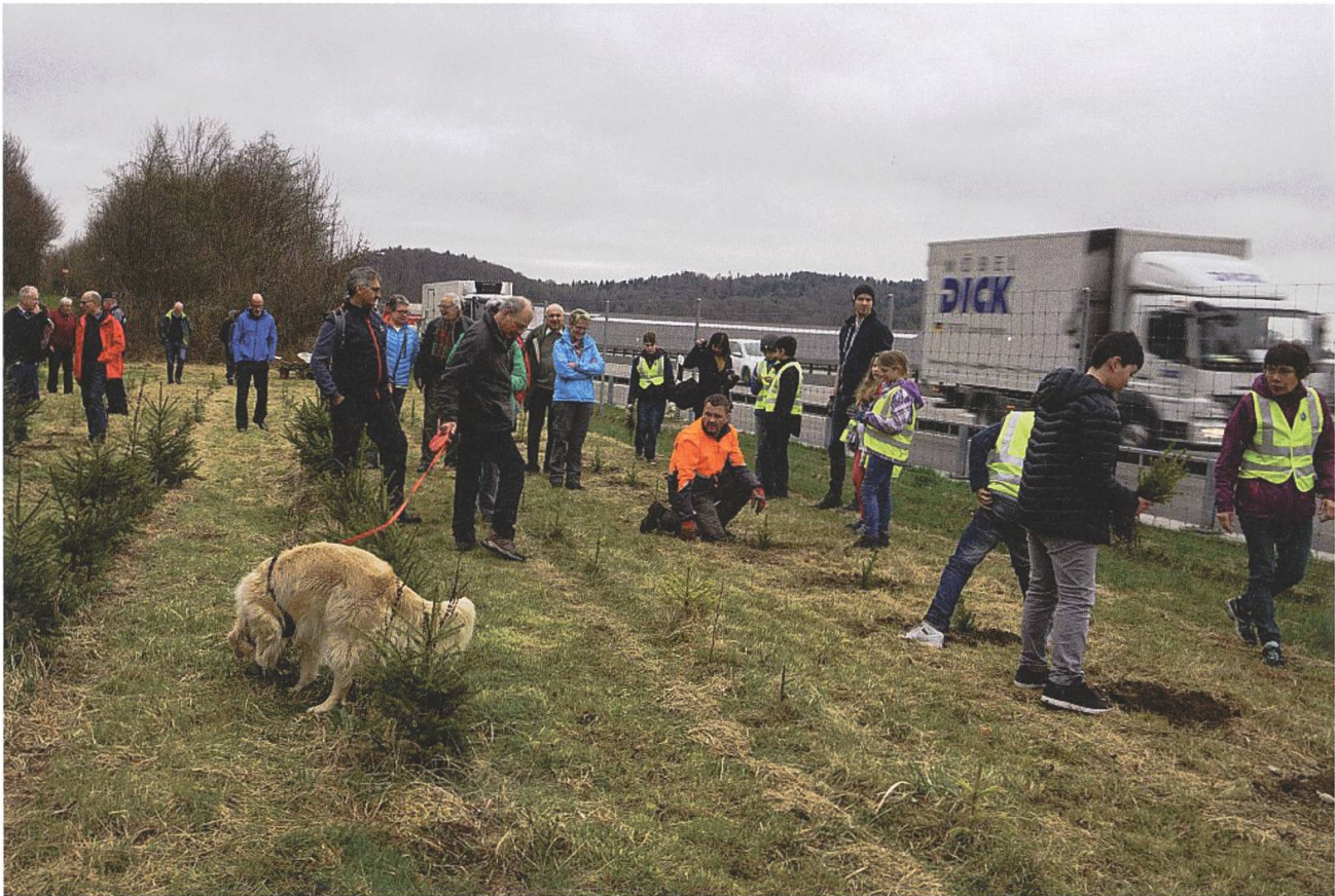
Am Baumpflanzet 2017 wurden entlang der Autobahn A1 Weihnachtsbäume gesetzt. ms