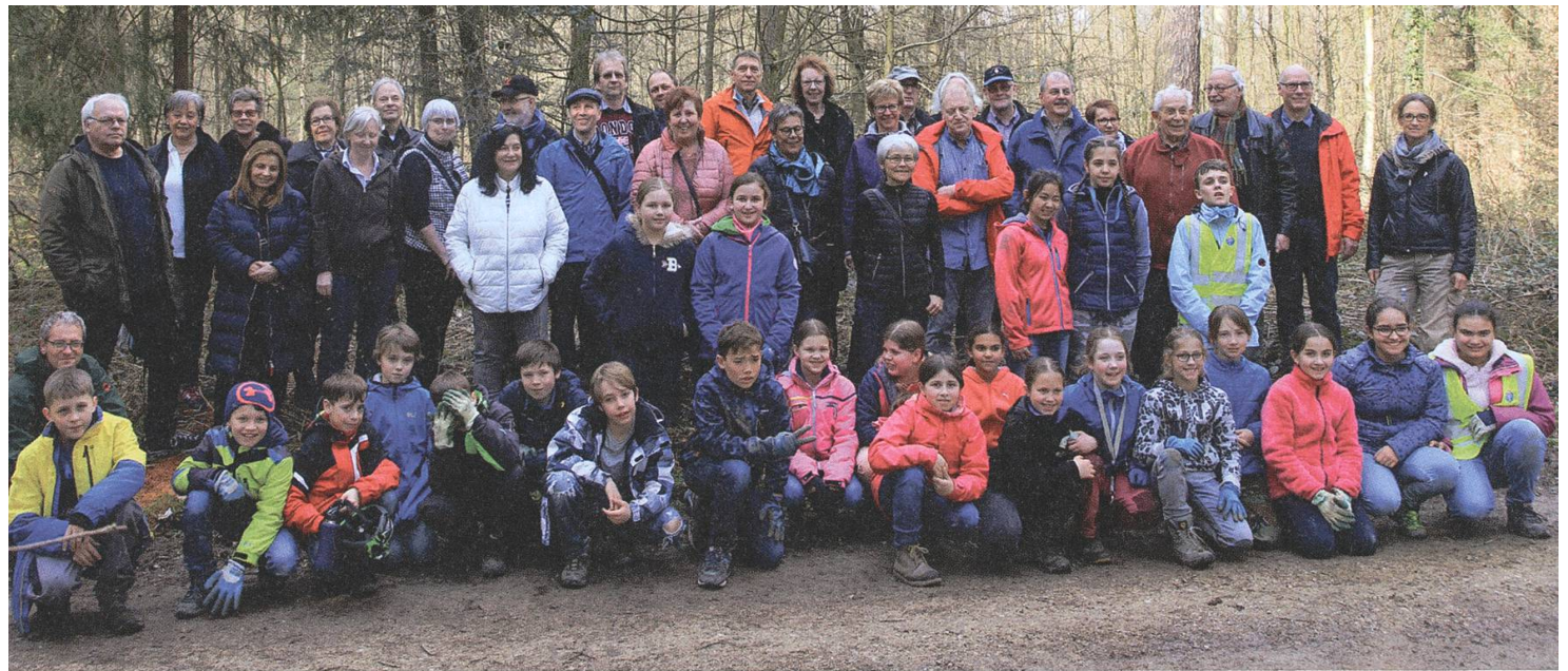
«Klassenzusammenkunft» der ersten und der jüngsten Baumpflanzer. gu

und klärte einen weiteren Aspekt des Baumpflanzets auf. Damals gab es durch gewaltige Stürme in den Monaten Februar und März grosse Windfallschäden, so dass die Schüler willkommene Hilfen bei Aufräum- und Aufbauarbeiten waren. Der Tag des Baumes, initiiert und organisiert von der Ortsbürgerkommission, ergänzte die Öffentlichkeitsarbeit durch die traditionellen Waldumgänge, anfänglich nur für stimmfähige Ortsbürger, womit die Frauen vorerst automatisch ausgeschlossen waren! Immerhin organisierte man(n) dann fünf spezielle Frauen-Waldumgänge, und als diese dann das Stimmrecht erhielten, wurden die gemischten Wanderungen zur Familienangelegenheit, wozu in den letzten Jahren auch hin und wieder sämtliche Lenzburger Einwohnerinnen und Einwohner zugelassen werden. Ergänzend gab es noch fünf Grenzumgänge und gelegentliche Kieswerk-Besichtigungen.