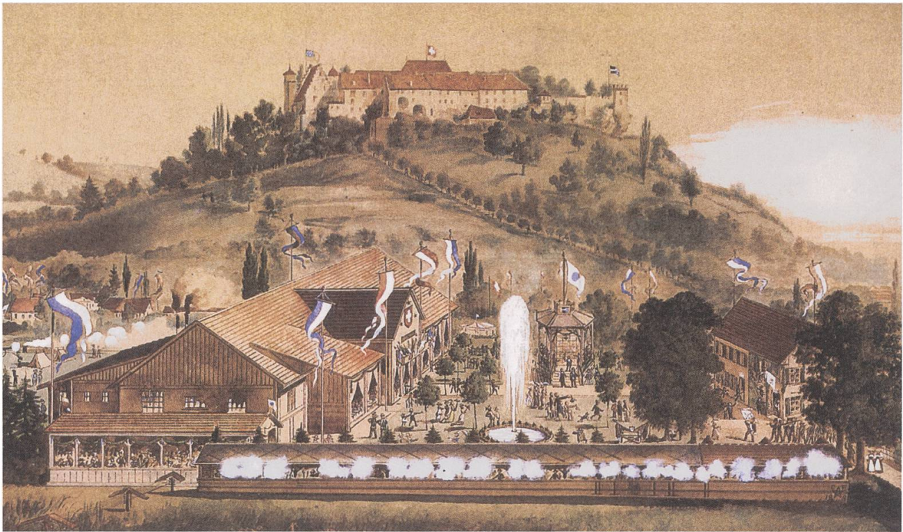
Carl Andreas Fehlmann (1829–1908), Aquarell «Aarg. Cantonal-Schützenfest 13.–21. Juni 1880».

war mit ein Grund dafür, den Durchbruch zu errichten, der den direkten Zugang aus der Altstadt zur Bahnhofstrasse und damit zum Bahnhof als damaliges Tor zur Welt ermöglichte.