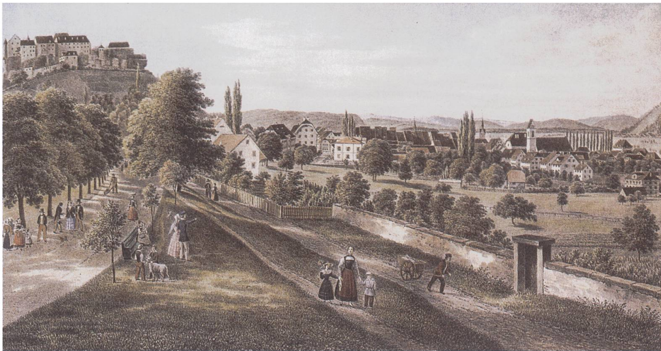
Heinrich Triner (1796–1873), kolorierte Lithographie «Ville et Château de Lenzbourg».

der Krone, welche erst später zum Gasthofe erweitert wurde. Statt der Mauern, welche die Strasse heute einfassen, waren da Böschungen. Im Schiessstand begann ein fröhliches Wettschiessen. Nicht so schnell aufeinander folgten sich die Schüsse wie heute; aber dafür donnerten sie kräftig hinauf ans Schloss und weckten dort das schlummernde Echo. Mächtig wallte der Pulverdampf in die blaue Frühlingsluft. Damals dachte niemand, dass nach etwas mehr als fünfzig Jahren am oberen Tore angeschlagen würde: «Liberté, Egalité,» und dass das Berner Wappen je entfernt würde (1798).