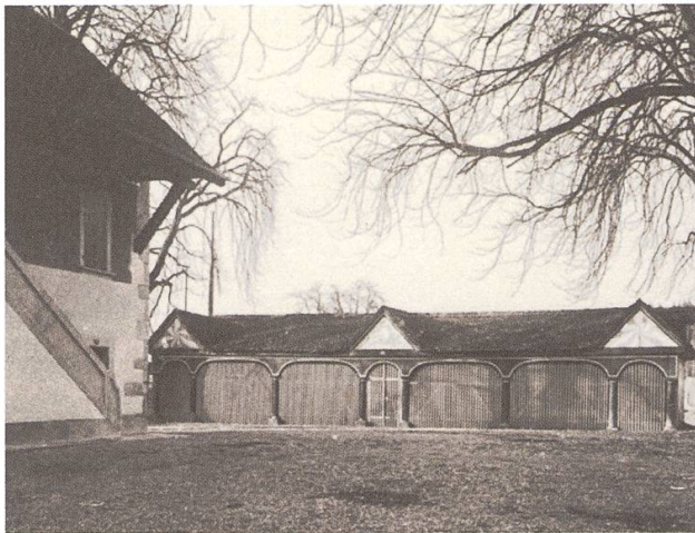
Der alte Schiessstand vor seinem Abbruch 1911.