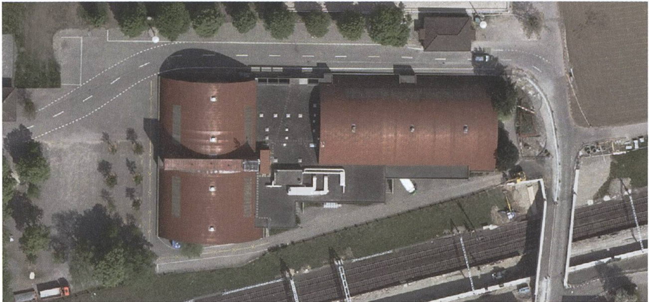
1968/69 wurde die Mehrzweckanlage (Mehrzweckhalle, Militärräume, Reithalle) erstellt.