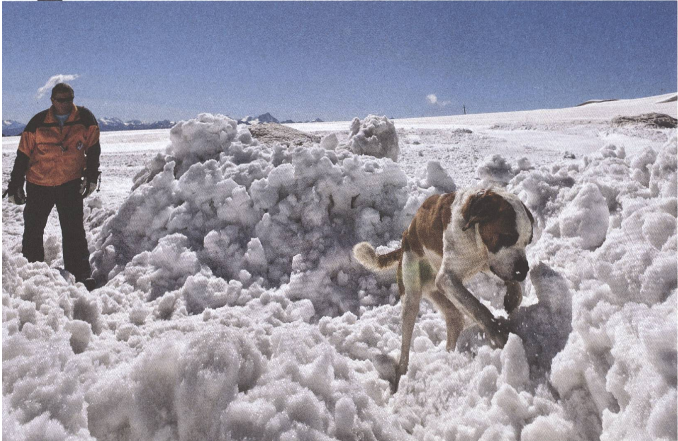
Weltkulturerbe: Expertise der Schweiz im Umgang mit der Lawinengefahr