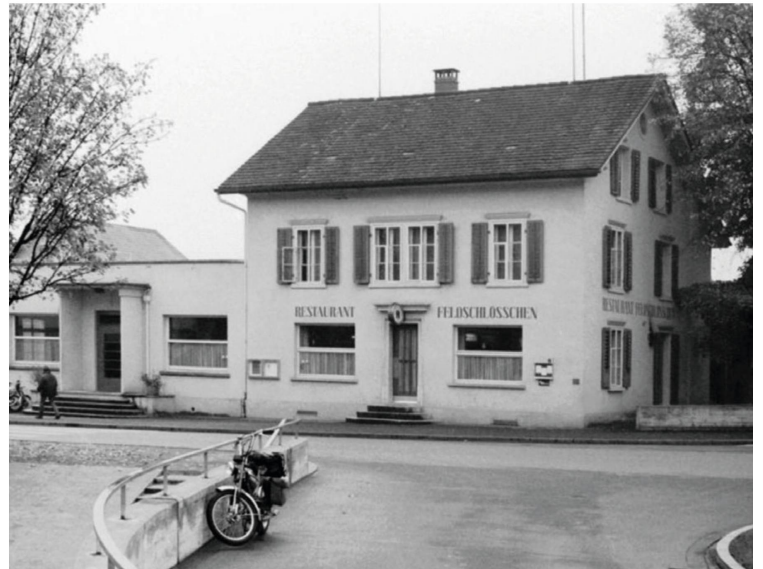
Das ehemalige Restaurant Feldschlösschen 1980 vor dem Umbau zum Dancing