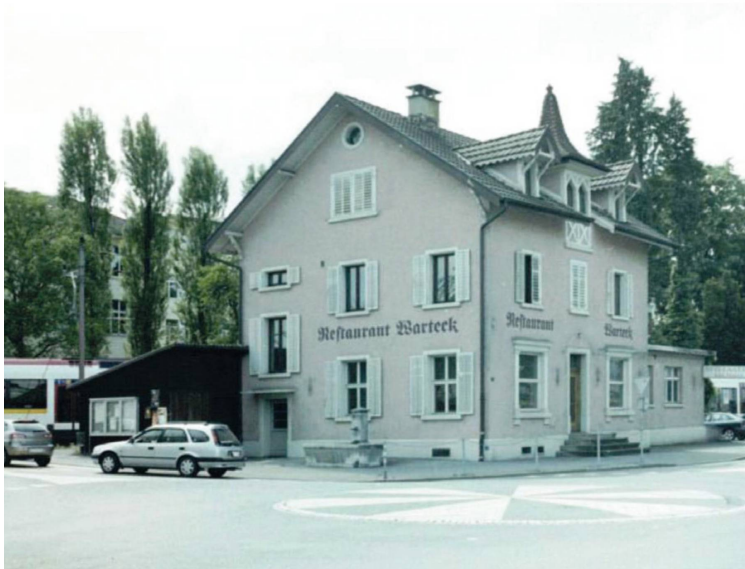
Das Restaurant Warteck 2005, vor seinem Abbruch