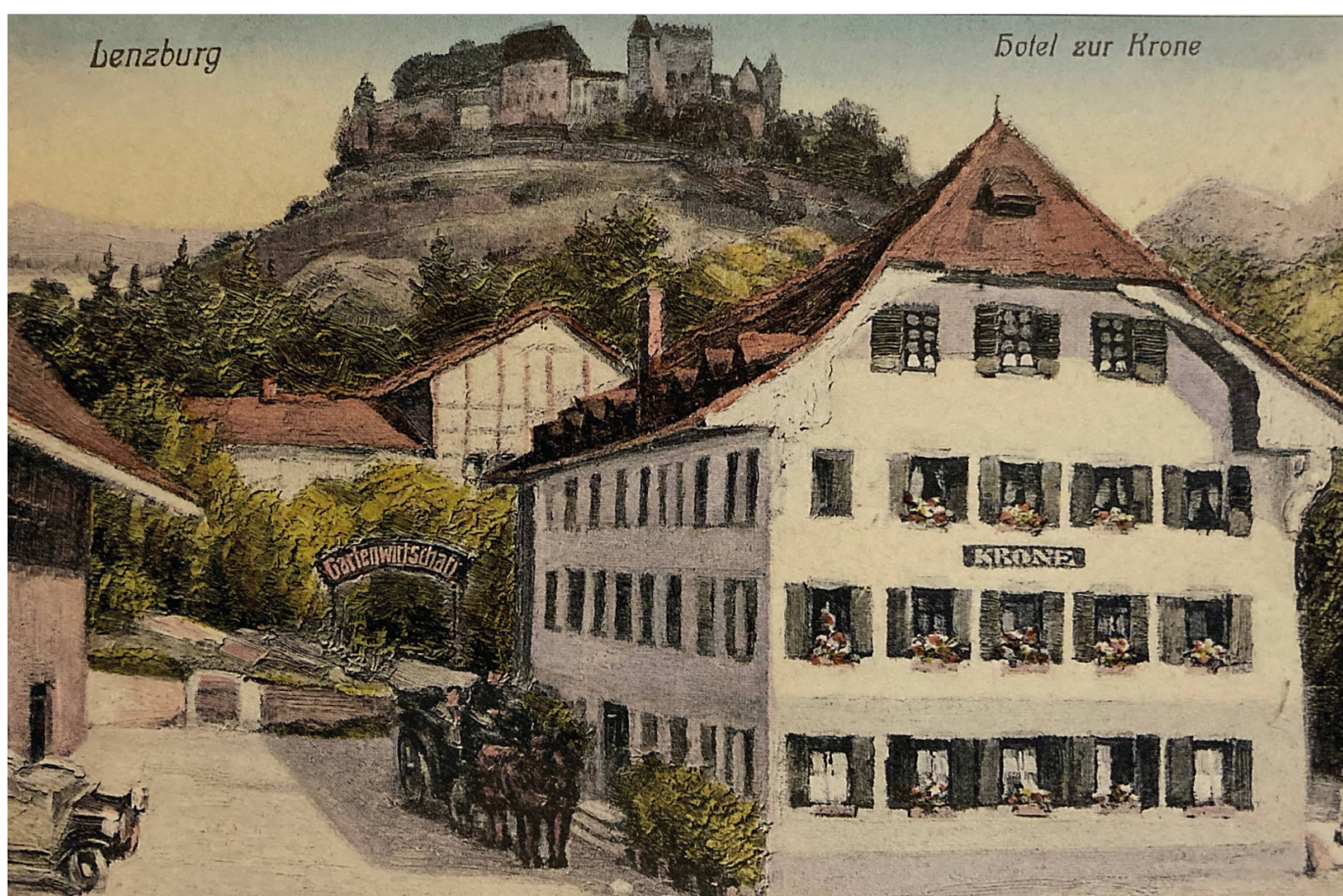
Postkarte des Hotels Krone mit werbetechnisch geschickter «Umplatzierung» des Schlosses

Käthi Gerber-Gruber und ihr Mann Otto führten die Krone von 1985 bis 2015. Dann verkauften sie den Betrieb, da die Nachfolge ausserhalb der Familie geregelt werden musste. Seit 2017 empfängt das Traditionshaus seine Hotelgäste unter dem Namen «Mercure» der französischen Hotelgruppe Accor.