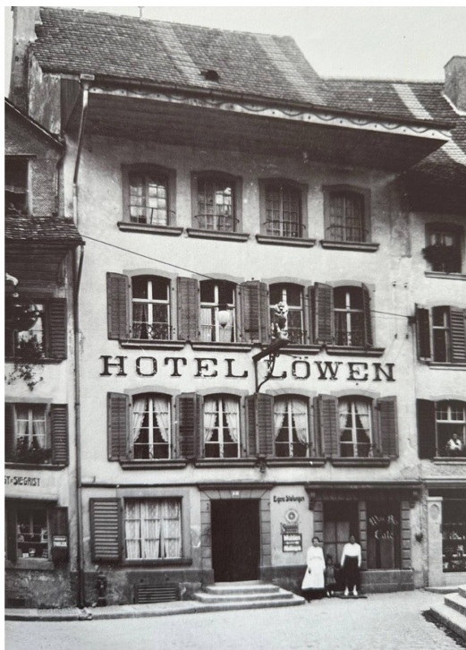
Lange das beste Haus am Platz: das Hotel Löwen um 1917