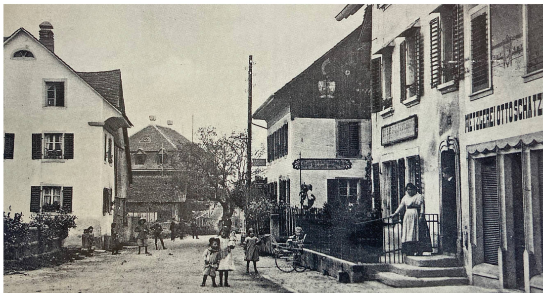
Metzgerei und Gasthof Ochsen Anfang des 20. Jahrhunderts

Das einzige Lenzburger Hotel in Familienbesitz