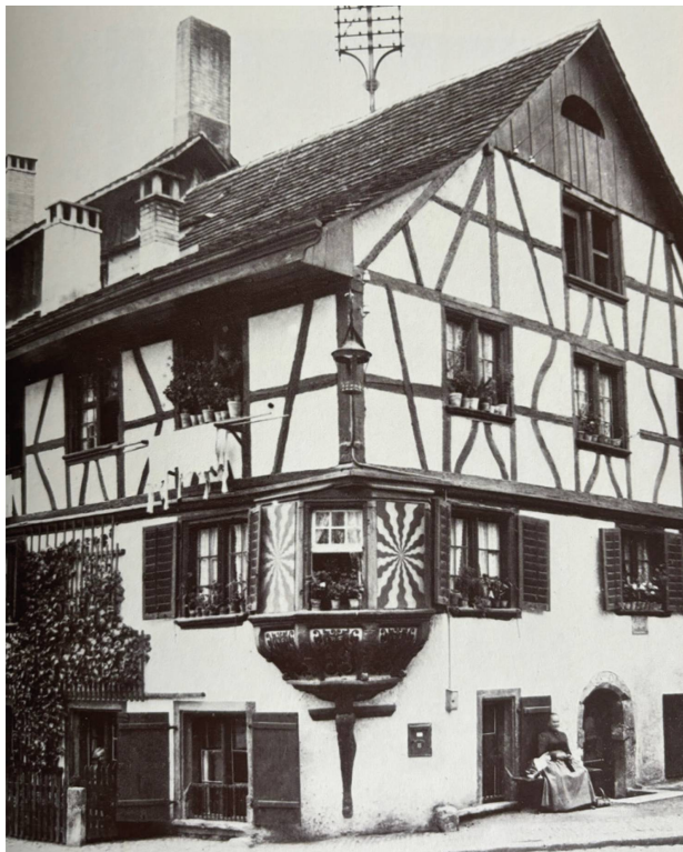
Das alte Landgericht – damals als Heimatmuseum