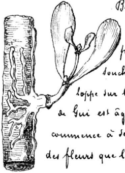
Branche de Sapin blanc, dépouillée de son écorce, pour montrer comment la souche s'épanouit et se divise. La tige sur l'ambire, la jeune plante de hui est âgée de 3 ans; elle ne commence à se ramifier et à porter des fleurs que les 4 e et 5 e années.