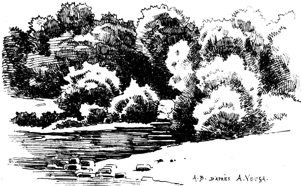
A. B. D'APRÈS A. YOUNG.

Longtemps les pures et simples jouissances de l'étude, de la contemplation, des rêveries et des promenades indolentes ont semblé le privilège, ou peut-être la misère, des oisifs, des curieux, des poètes, des savants, race inutile, — aujourd'hui c'est le pain des travailleurs la récompense et