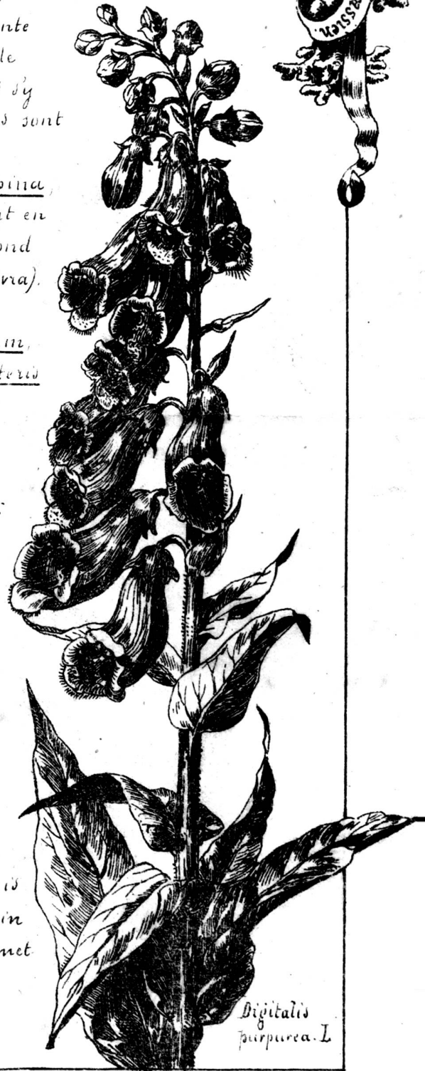
Digitalis purpurea. L.