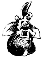
Fleur détachée de l'Ophrys fuci- flora.