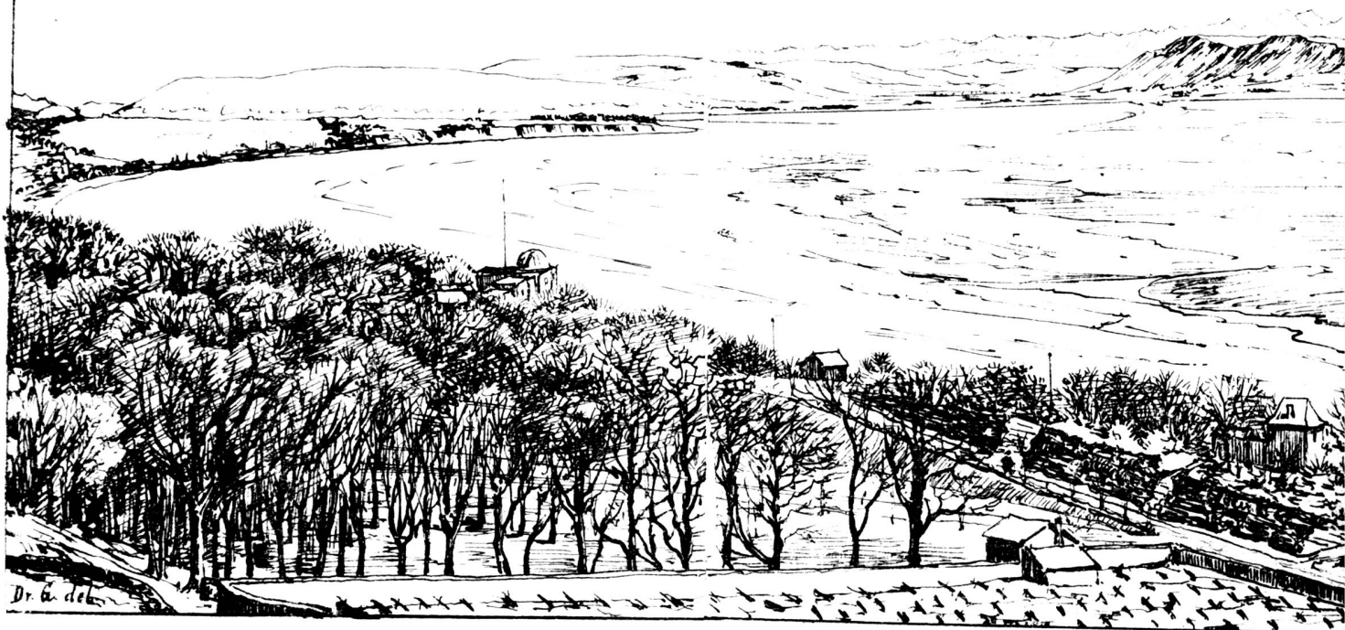
Vue du lac gelé, prise du sommet du Mail, le 19 Février 1880, dernier jour du gel.

comme des chiens, d'où leur vint leur nom de Cinopodes. D'autres ont la plante des pieds tournée en arrière avec sept doigts à chaque pied. Ils habitent les déserts de la Syrie. La dicote en nourrit de bonne humaine, mais avec pied de cheval; quelques uns les nomment Latmia. Isidore en décrit encore plusieurs autres espèces, en citant les écrits de Solin et de Plin e .