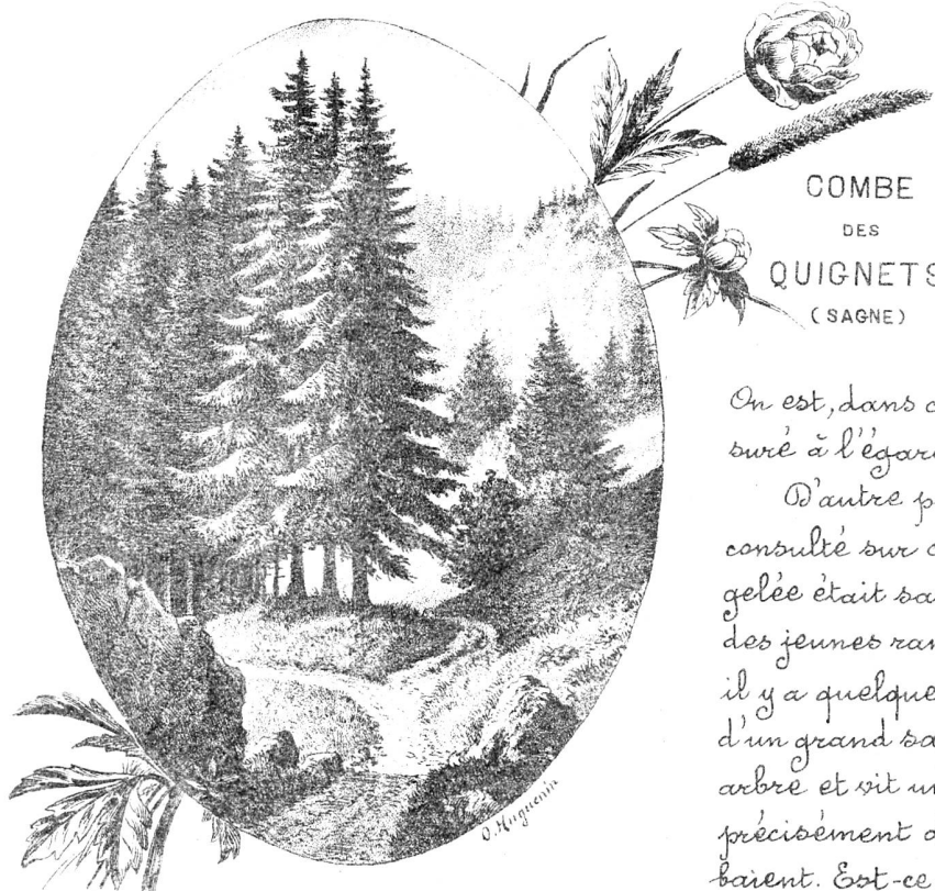
COMBE DES QUIGNETS (SAGNE)

seur, a traité la question et déclaré que tous les rameaux tombés portent à leur base une excroissance ressemblant quelque peu à la noix de galle. Cette excroissance est due à la présence d'un insecte ( Blatt-laus ), qui y vit et s'y propage.