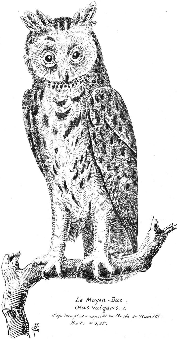
Le Moyen-Duc. Otus vulgaris . L.

D'après l'exemplaire empaillé au Musée de Neuchâtel. Haut: " 0,35.