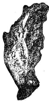
Feuille de Sempervivum tectorum L., après la sortie de la larve.