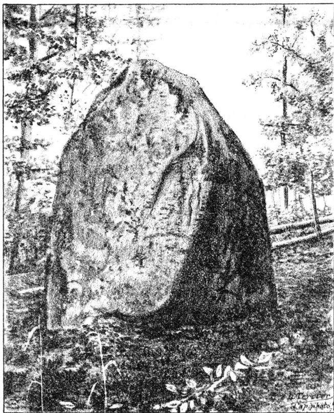
La véritable « Pierre-à-Baret » au Nord du chemin de la Châtelainie.