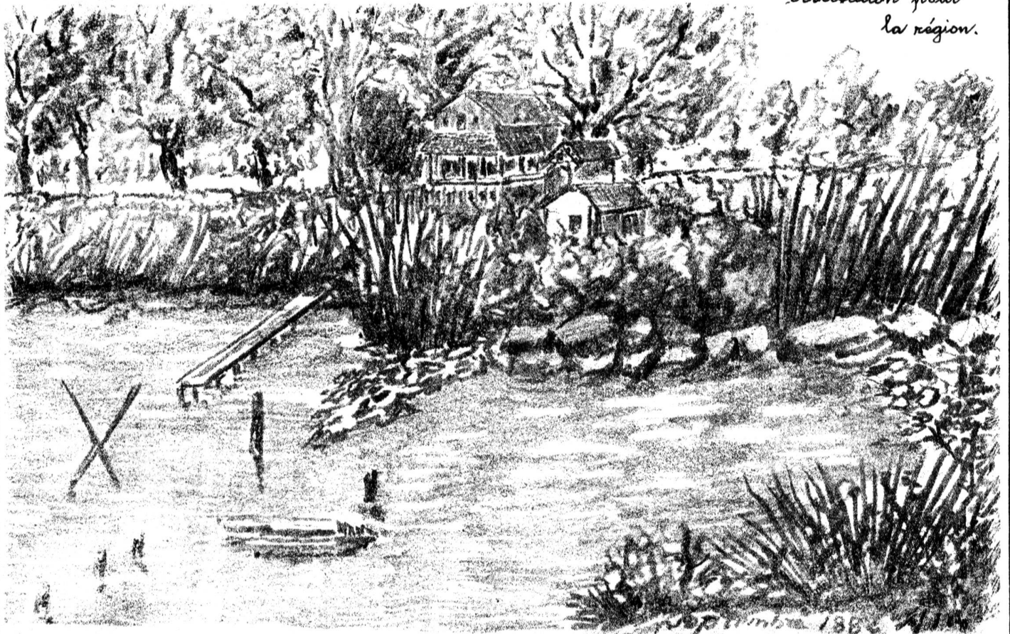
Effets de l'abaissement des eaux du lac, la rive devant le Chalet des Allées (Colombier), en septembre 1882 (Reproduction d'un croquis de l'époque).

30.9.08 deux ind. survolent la pépinière Neger, à 19 h. ; 10.5.13 un ind. couché en long sur une grosse branche d'un pommier au Bas de Sachet (Cortailod), il y reste jusqu'à l'approche de la nuit. 12.5.14 au soir, un ind. volant près des pins du Grand Verger; 13.5.14, à 17 h. 2 ind. sous les pins du G d Verger. 30.8.14, soir 19 h. un ind. survolant la pépinière Neger, à Colombier. — 24.4.15, 20 h. un engoulevent au même endroit; en mai et juin 15, observations régulières aux Allées. — 28.6.18, à 18 h. 30, 2 tette-chèvres en chasse le long des grèves, au Bied; depuis cette dernière date aucune nouvelle observation pour la région.