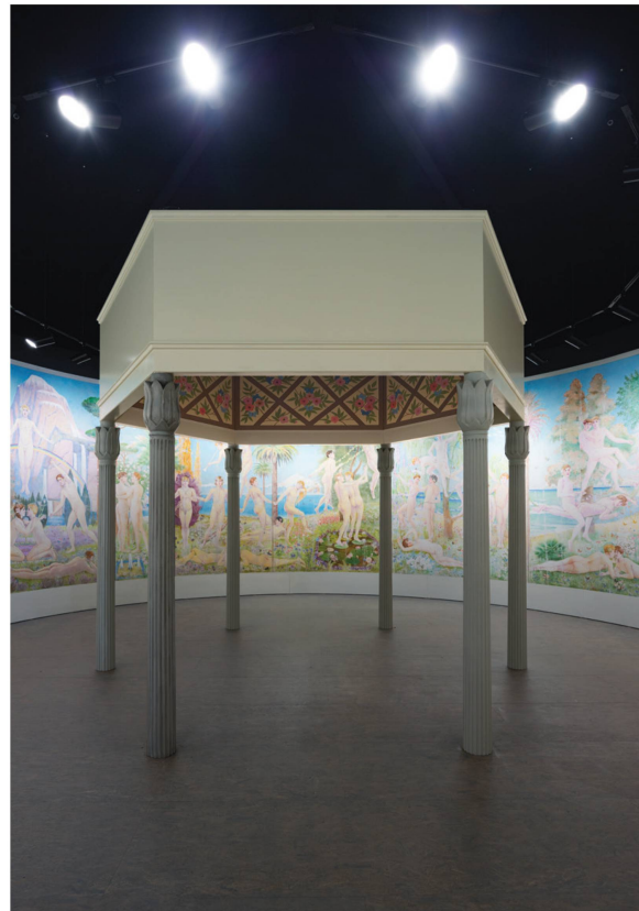
In der Casa Anatta (l.) und im Elisarion-Pavillon (r.) in die Geschichten und Ideale des Monte Verità eintauchen.

Museum führt. Pläne fand man keine, auch anlässlich der Renovierung nicht, und lange vermutete man theosophische Grundsätze hinter den ungewöhnlichen Proportionen und Formen. Heute allerdings gibt es eine zweite Theorie: Henri Oedenkoven, der das Startkapital für die kleine Gemeinschaft mitbrachte und die Casa Anatta bauen liess, stammte aus einer Schiffbau-Dynastie in Antwerpen. Tatsächlich ist man auf den zweiten Blick an ein grosses Hausboot erinnert, das hier über dem See seinen Ankerplatz gefunden hat.