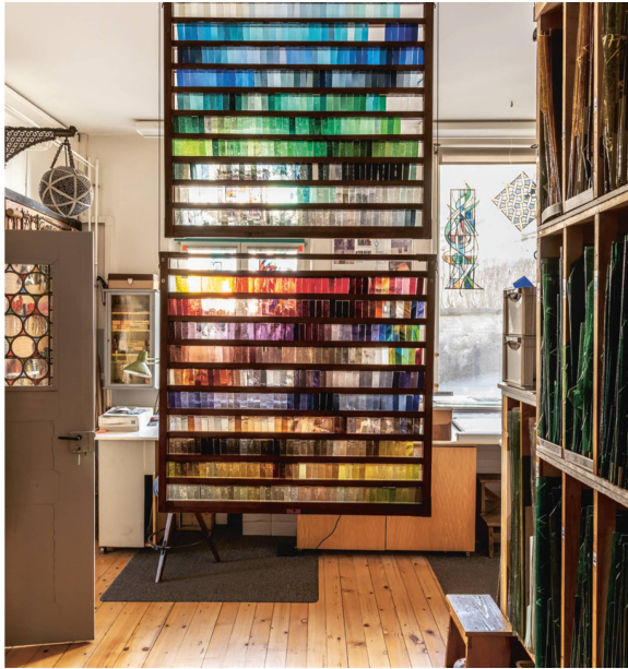
Musterrahmen mit rund 800 Farbnuancen.