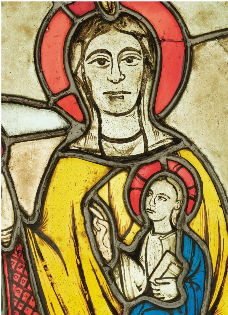
Das älteste in der Schweiz erhaltene mittelalterliche Glasgemälde: Maria mit Kind, um 1200, St. Jakobskapelle, Flums SG.

Als Vorlage verwendet der Glasmaler eigene Kreationen oder setzt Entwürfe anderer Künstler um. Die Vorlage wird auf ein dickeres Schablonenpapier übertragen und alle Felder werden nummeriert, damit sie nicht verwechselt werden. Um die Schablonen auszuschneiden, greift der Glasmaler zu einer Spezialschere, die zwischen den Einzelteilen einen 1,5 Millimeter breiten Streifen entfernt. In diese Lücke kommt später das für Glasgemälde so charakteristische Rahmenwerk aus Blei.