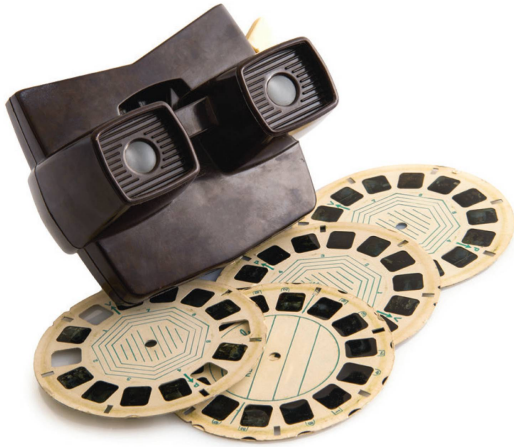
Der Viewmaster war ab 1939 in den Kinderzimmern zu finden.

der Folge war es möglich, Bilder mit einem räumlichen Eindruck von Tiefe wiederzugeben. Zur 3D-Wahrnehmung ist ein Betrachtungsgerät notwendig, durch den das linke und das rechte Auge getrennt auf zwei leicht unterschiedliche, zweidimensionale Bilder schauen. Daraus konstruiert das Sehzentrum des Gehirns ein räumliches Bild.