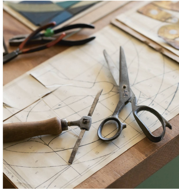
Messer & Spezialschere für die Schablonen.

Sind die Schablonen ausgeschnitten, hat der Glasmaler die Qual der Wahl aus über 5000 Farbnuancen. Wie aus einem Farbkasten wählt er für jedes Teil das passende Glas. Dieses stellt er nicht selbst her, sondern kauft es bei einer Glashütte ein. Die Schablonen und Gläser übergibt der Glasmaler dem Kunstglaser, denn das Ausschneiden der Glasteile erfordert Erfahrung und Geschick – je nach Werk sind es mehrere Hundert Teile in allen möglichen Formen. Als Messer dient ein Diamant. Dabei besteht immer die Gefahr, dass ein Glas bricht.