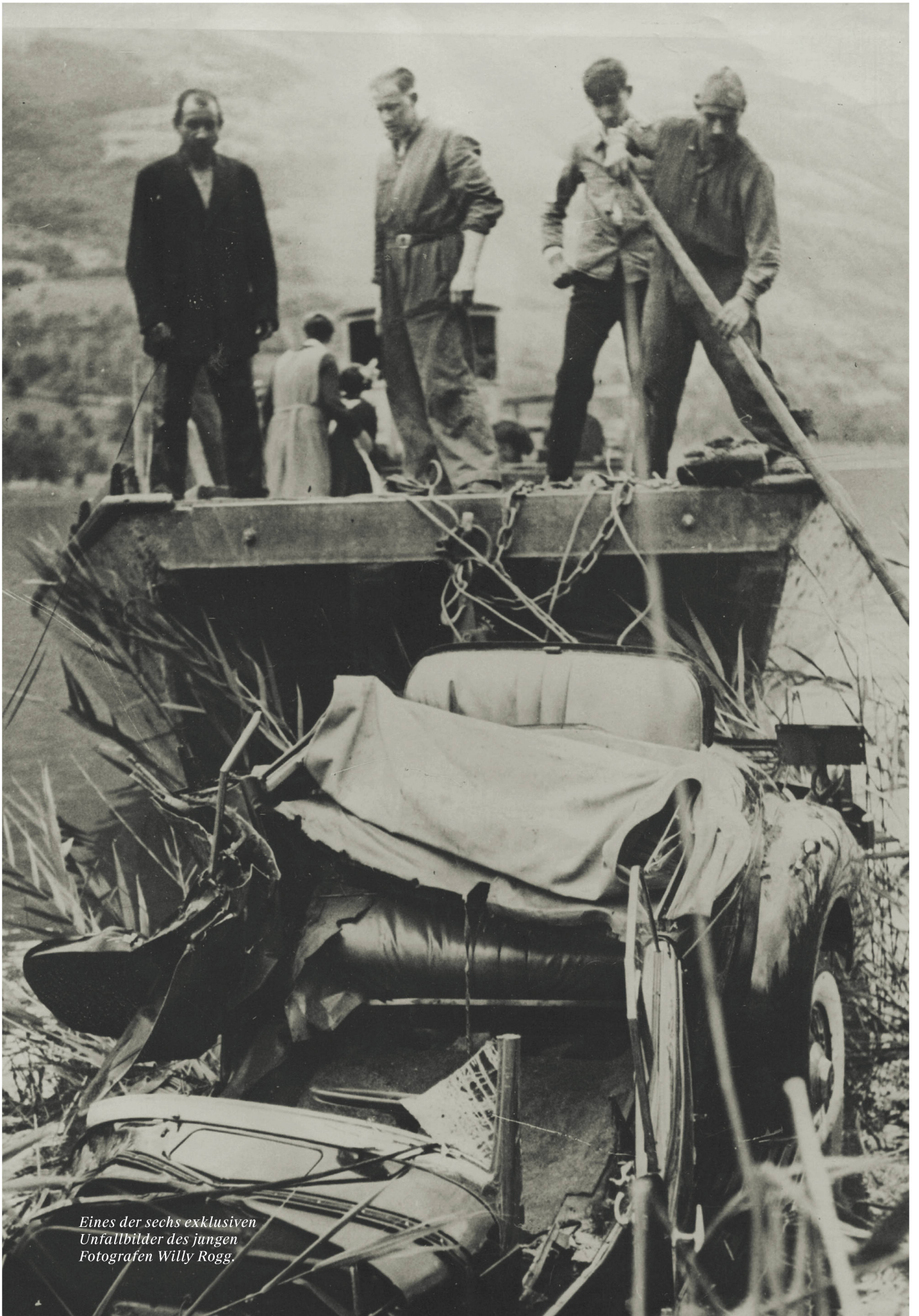
Eines der sechs exklusiven Unfallbilder des jungen Fotografen Willy Rogg.