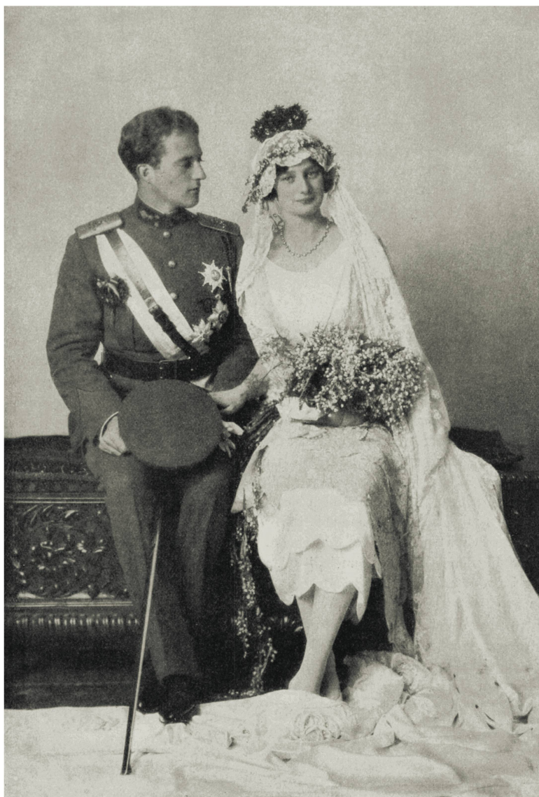
Leopold III. von Belgien heiratet 1926 die 19-jährige Astrid von Schweden.