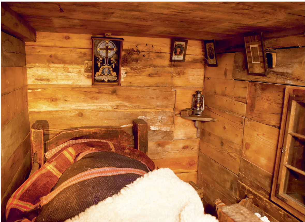
Die Einrichtungen gewähren Einblick ins Leben der Zermatter Bevölkerung im 19. Jahrhundert.