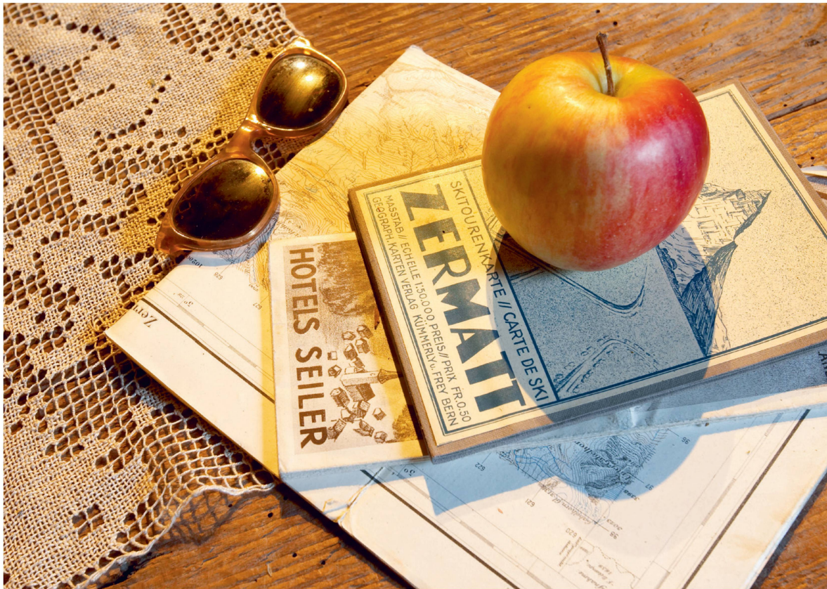
Die Ausstellung Zermatlantis entführt auf eine Zeitreise in die Vergangenheit von Zermatt.

Hotels auftauchen, wie 1852 das Mont Cervin oder 1854 das Monte Rosa. Der grosse Ruhm, und damit der grosse Run auf den damals noch kleinen Ort, kam aber erst im Sommer 1865, mit der Erstbesteigung des Matterhorns.