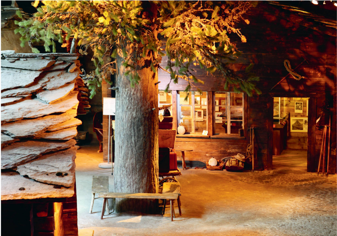
Dreh- und Angelpunkt ist der nachgebaute historische Dorfplatz.