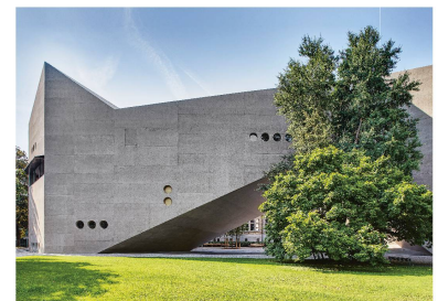
Une grande passerelle relie le Musée national au parc Platzspitz.

les lucarnes rondes, qui rappellent les hublots d'un bateau, permettent aux seconds de s'orienter sur les passerelles et dans les larges cages d'escalier et de jouir de jolis points de vue. Avec ce concept, ce sont non seulement les nouvelles expositions, mais aussi l'architecture même du musée, qui, sans s'imposer, créent l'événement. Personne n'a sans doute mieux décrit le projet qu'Orhan Pamuk, prix Nobel de littérature, pour qui « les vrais musées sont des lieux dans lesquels on transforme le temps en espace ».