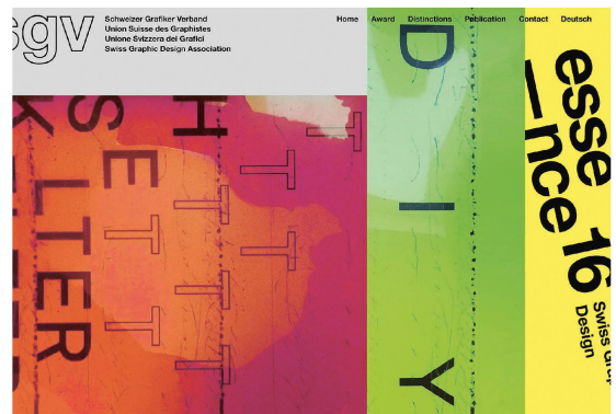
L'Essence 16 Awards du Best of Swiss Graphic Design est cette année remis au Musée national.