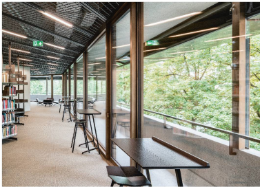
La salle de lecture de la bibliothèque et du Centre d'études, avec vue sur l'extérieur.

de jeter des passerelles, transparait dans toute la nouvelle aile, qui reprend certaines caractéristiques du bâtiment historique (utilisation de tuf pour la façade, notamment) et s'inspire de la géométrie du parc qui s'ouvre devant elle. Les architectes ont aussi voulu concilier les besoins des conservateurs et ceux des visiteurs : des salles d'exposition hautes, parfois dépourvues de fenêtres, créent des conditions idéales pour les premiers tandis que