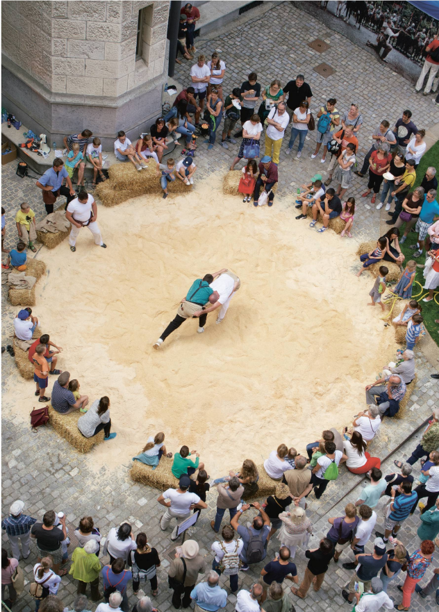
Les démonstrations de lutte suisse dans la cour intérieure ont connu un grand succès.