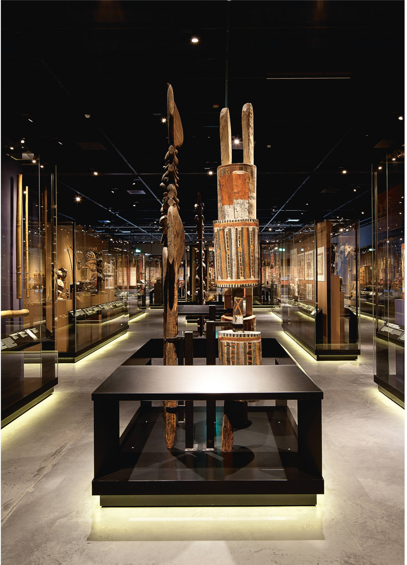
Tous les ethnologues se doivent de visiter le MEG. Le musée abrite quelque 70'000 pièces venues du monde entier.