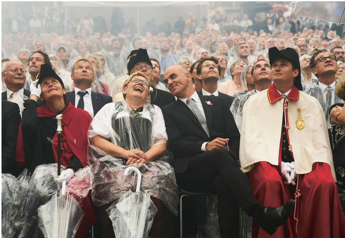
L'inauguration du nouveau bâtiment du musée a manifestement bien plu au conseiller fédéral Alain Berset !