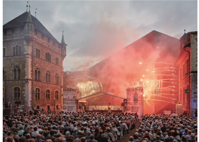
Les quelque 2000 invités ont pu admirer un magnifique feu d'artifice.

suisse » ont affiché complet, à l'instar des activités destinées à un jeune public. La manifestation s'est déroulée comme prévu et sans fausse note. Même la pluie est tombée à point nommé pour baptiser le bâtiment dans les règles.