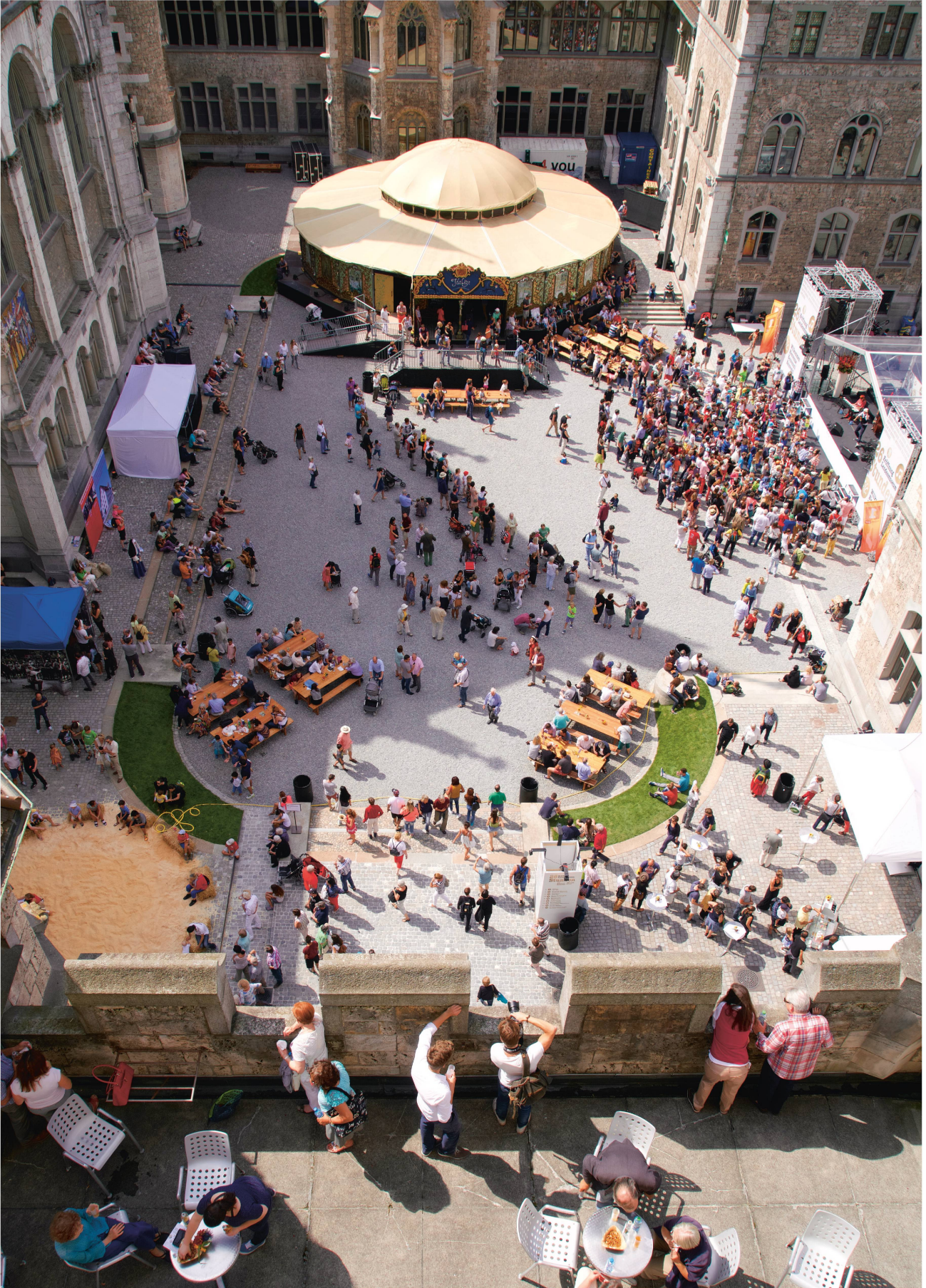
Le programme était attrayant pour tous les visiteurs.