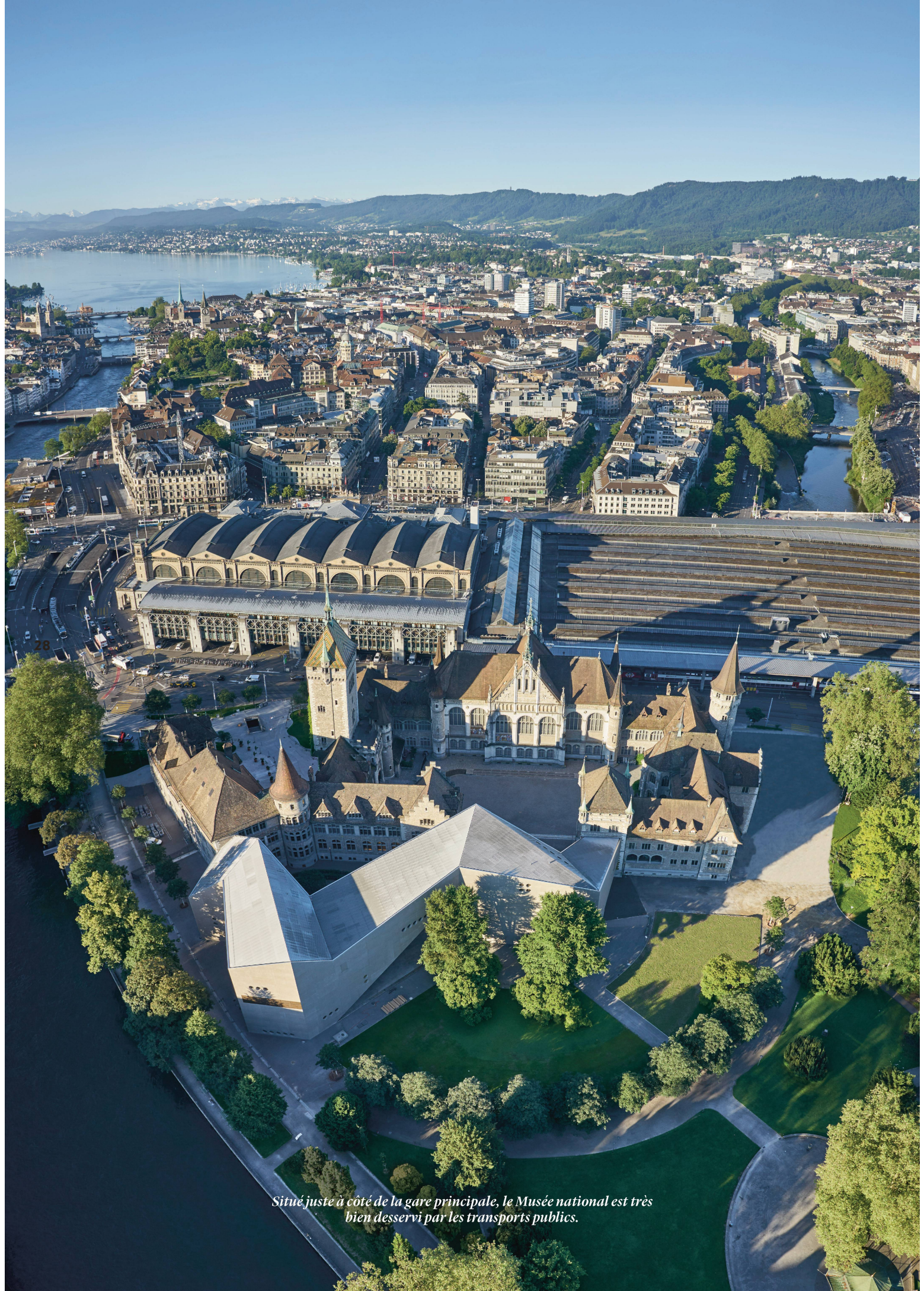
Situé juste à côté de la gare principale, le Musée national est très bien desservi par les transports publics.