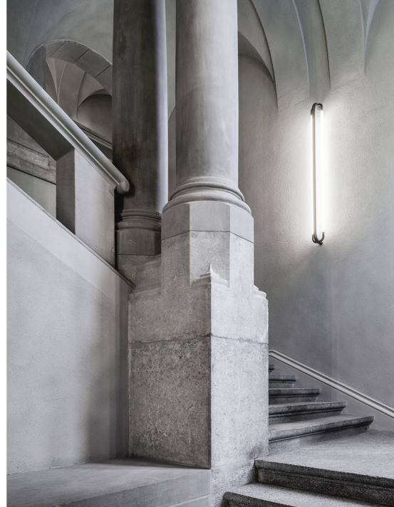
L'aile de l'ancienne école d'arts appliqués a été rénovée avec amour jusque dans les moindres détails, de manière à se marier parfaitement avec le nouveau bâtiment du musée.