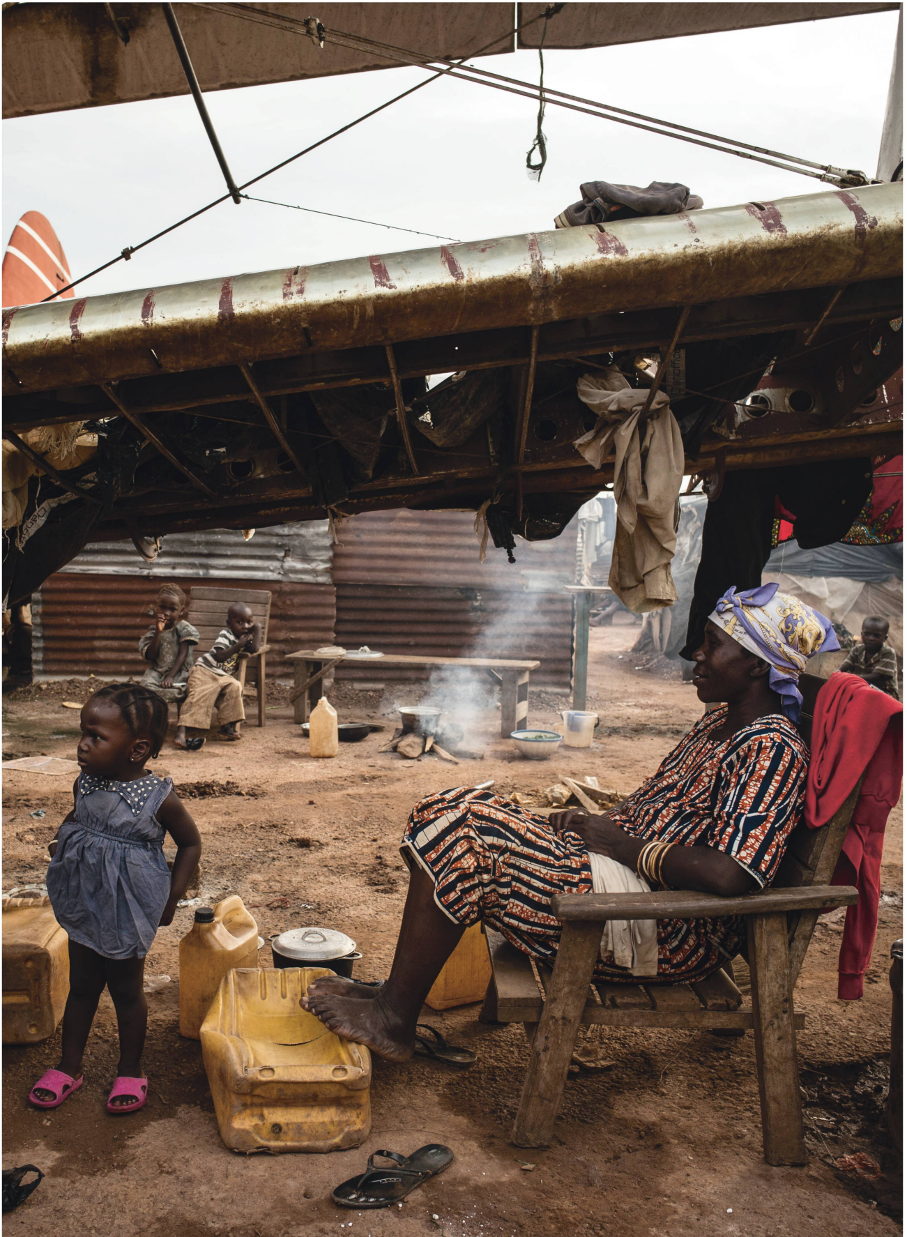
A travers cette exposition, les visiteurs du musée expérimentent ce que peut ressentir un réfugié.