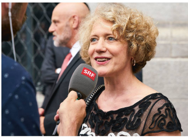
Interview de la maire de Zurich Corine Mauch.

L a fête a été des plus réussies. Le soir du 31 juillet 2016, l'inauguration officielle du nouveau bâtiment du Musée national par le conseiller fédéral Alain Berset, en présence des représentants de tous les gouvernements cantonaux, de la maire de Zurich Corine Mauch et de nombreuses personnalités, a marqué le coup d'envoi des réjouissances.