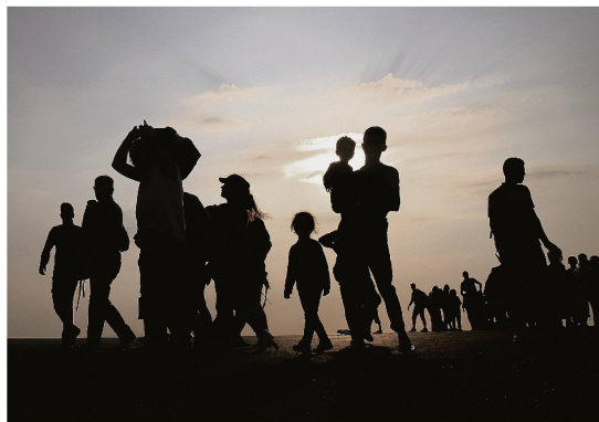
Triste record : près de 65 millions de personnes sont actuellement réfugiées.

Cette exposition est un projet commun de la Commission fédérale des migrations (CFM), du Secrétariat d'Etat aux migrations (SEM), de l'Haut Commissariat des Nations Unies pour les réfugiés (UNHCR) et de la Direction du développement et de la coopération (DDC). Elle s'intéresse au destin des réfugiés mais aussi aux mouvements des populations dûs au changement climatique et à des questions relatives à la diversité culturelle, à l'identité et aux opportunités offertes par l'intégration.