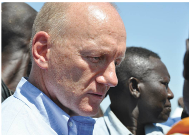
Manuel Bessler est le délégué à l'aide humanitaire de l'EDA.