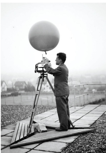
Durant les années 1930 et 1940, les vents d'altitude étaient mesurés à l'aide d'un ballon comme celui-ci.

En dépit des techniques les plus modernes, de la connectivité globale et de la capacité à suivre l'évolution du temps depuis l'espace, nombreuses sont les personnes qui se fient encore aux vieux dictons paysans. Ces adages populaires en vers sont transmis de générations en générations et surprennent par leur précision. Une grande partie de ces dictons ont été rédigés à une époque où on ne connaissait pas encore précisément les processus à l'origine de la pluie ou de l'orage. Ces phénomènes sont aujourd'hui bien connus et sont expliqués dans l'exposition. Différentes stations permettent également aux visiteurs de vivre de près le temps. Installé sur une grande banquette, il est ainsi possible de s'exposer à plusieurs changements météorologiques soudains. Un simulateur permet de créer sa propre tempête virtuelle. ☁