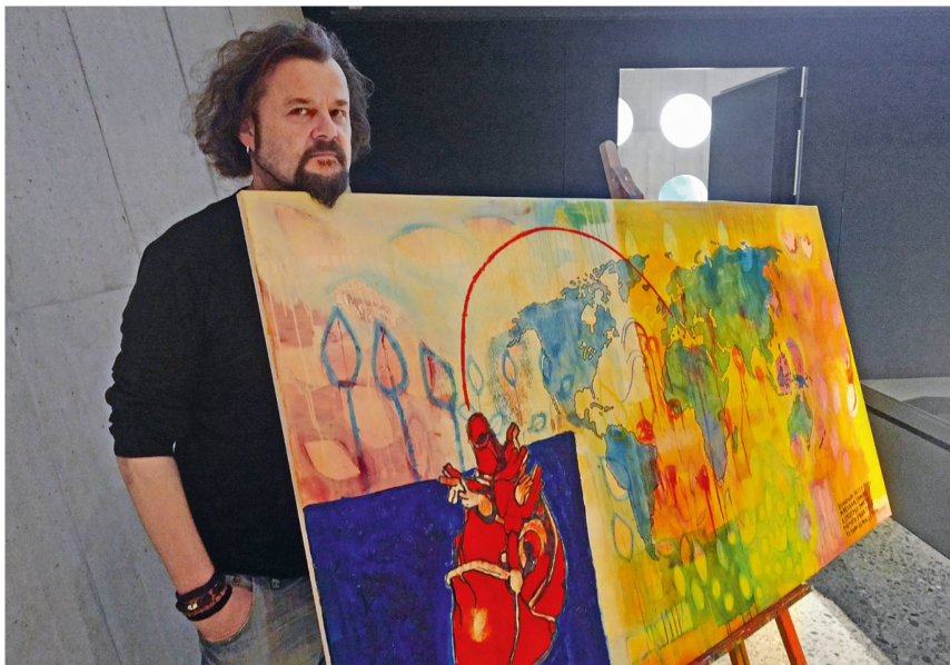
Au Musée national, Büne Huber, leader de Patent Ochsner, montre qu'il est un artiste éclectique.