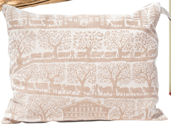
Paysage à l'arolle : Représentant l'Inalpe Poche en toile métis Jacquard / CHF 76