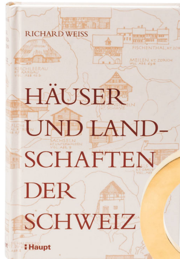
Livre : Häuser und Landschaften der Schweiz Richard Weiss, éditions Haupt, 2017 / CHF 38