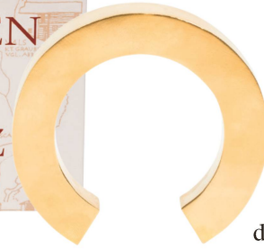
Bracelet : Big Hollow Felix Doll, laiton 24 ct doré / CHF 699