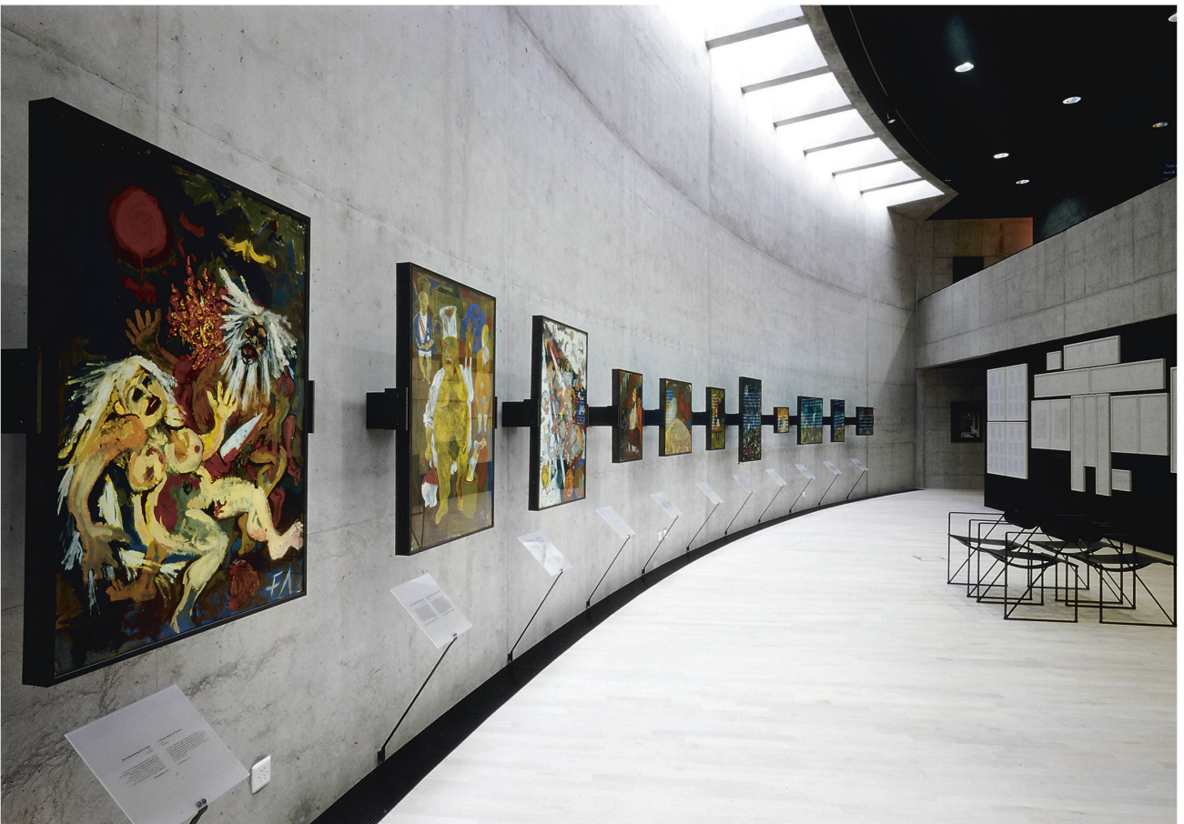
Le toit des salles d'exposition dessinées par Mario Botta sert de terrasse. L'on y jouit d'une vue imprenable sur le lac de Neuchâtel.