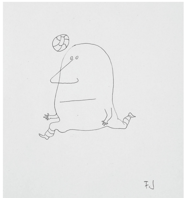
Friedrich D rrenmatt, [joueur de football IV], s.d., stylo   bille sur papier, 29,5 x 20,8 cm, collection du Centre D rrenmatt Neuch tel.