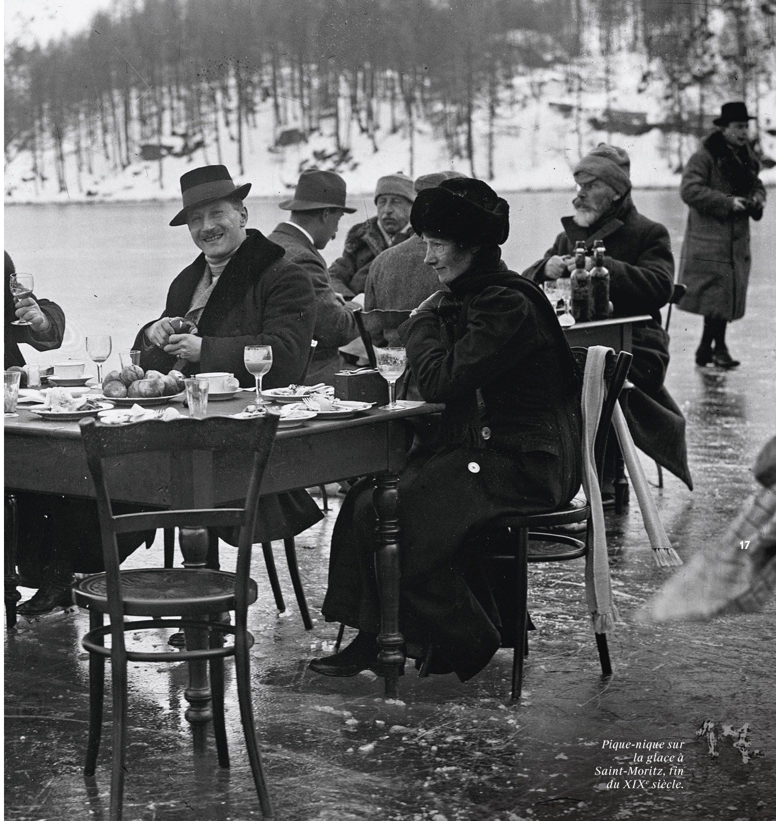
Pique-nique sur la glace à Saint-Moritz, fin du XIX e siècle.

Chaque région possède ses propres spécialités, à commencer par ses fromages. Des classiques comme la fondue ou le birchermüesli en font bien sûr partie mais aussi des spécialités moins connues et inscrites à l'inventaire du Patrimoine culinaire suisse. Tel est le cas du cardon de Genève vendu en décembre sur les marchés pour être cuisiné à Noël. Les huguenots de Touraine fuyant les persécutions religieuses ont emmené avec eux ce cousin de l'ar-