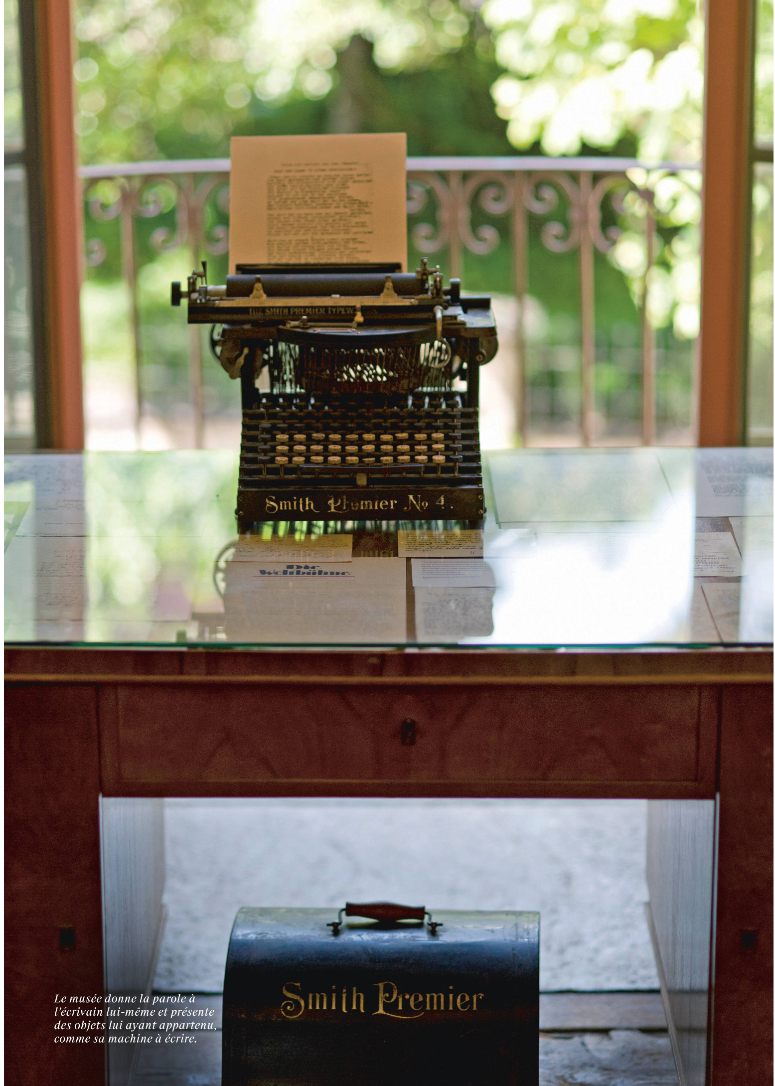
Le musée donne la parole à l'écrivain lui-même et présente des objets lui ayant appartenu, comme sa machine à écrire.