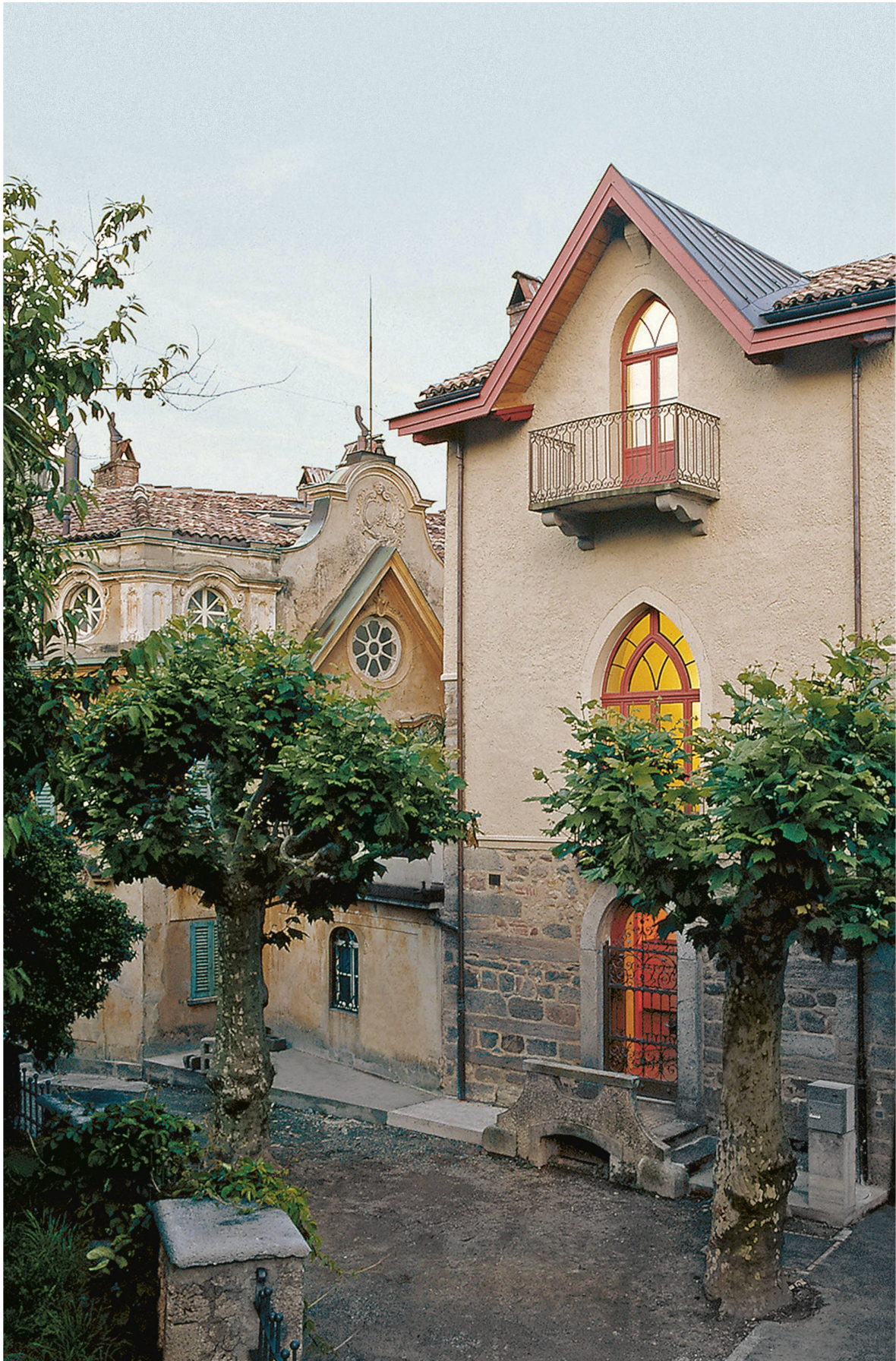
La Torre Camuzzi fait partie de la Casa Camuzzi, villa baroque, et abrite aujourd'hui le Museo Hermann Hesse.