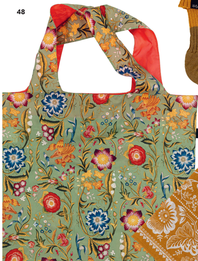
Sac pliable : motif fleuri tiré de la collection du Musée national suisse, Loqi «limited edition»/CHF 18.50