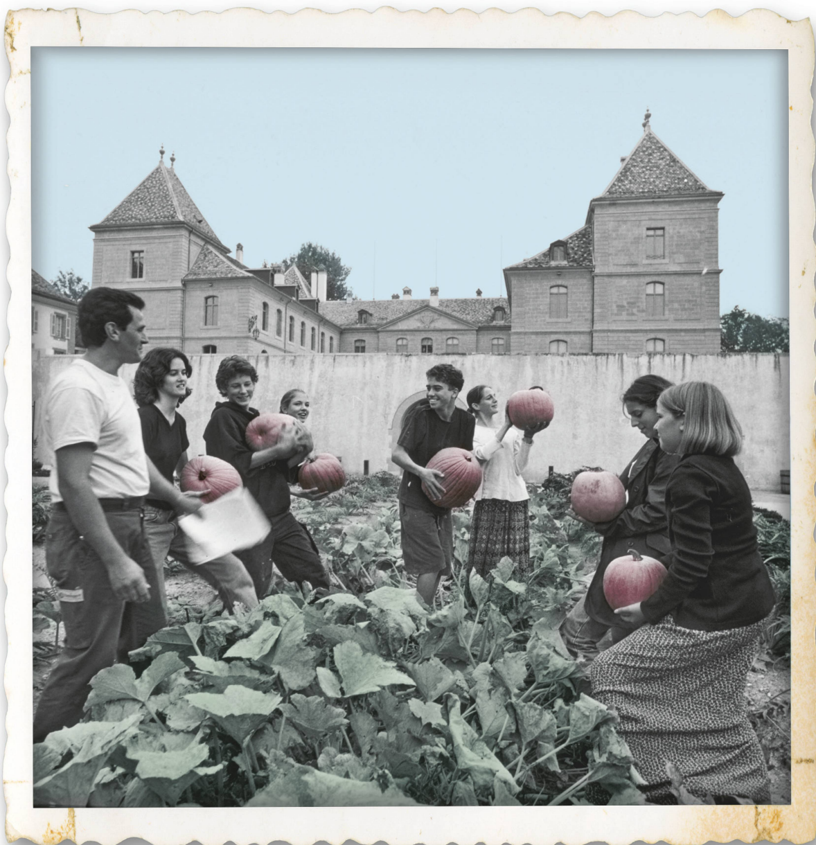
Récolte au jardin du Château de Prangins, 1997.

Dans les établissements du Musée national, l'automne sera placé sous le signe de la découverte et du plaisir.