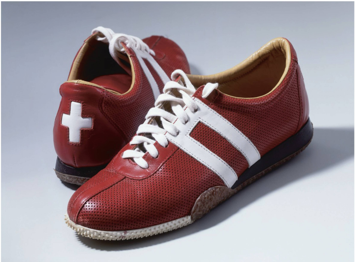
Horloge de gare et chaussures de Micheline Calmy-Rey : symboles de ponctualité et de diplomatie, deux qualités suisses « typiques ».