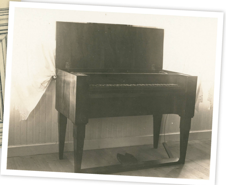
Certains objets n'ont pas été intégrés à la collection – il en reste cependant des traces.