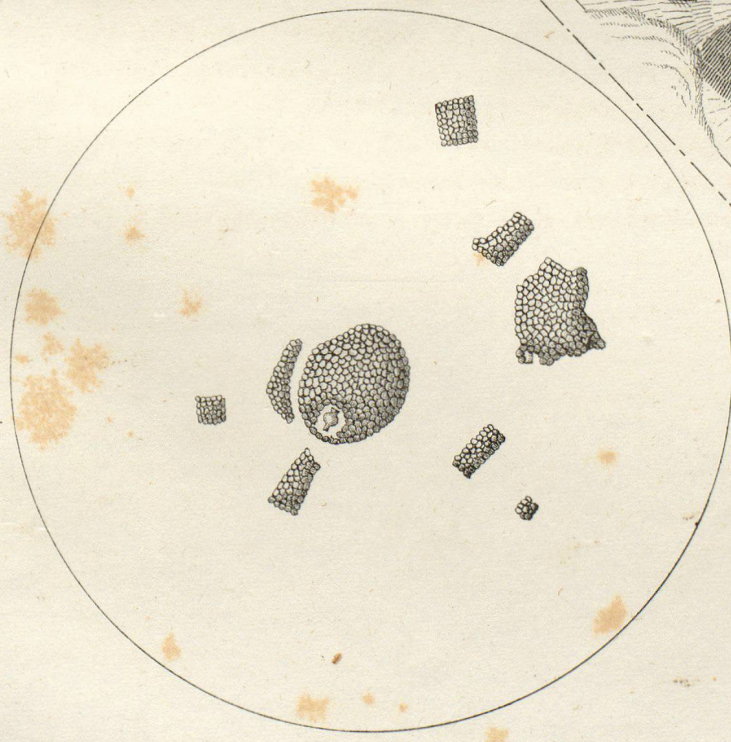
Maasstab v. 1/100 Fig's.