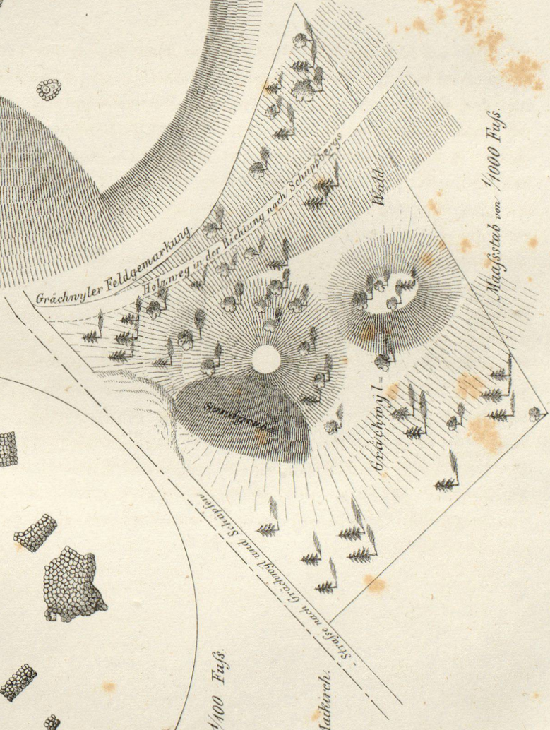
Maasstab von 1/1000 Fig's.