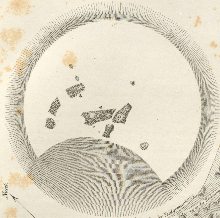
Maasstab von 1/100 Fig's.