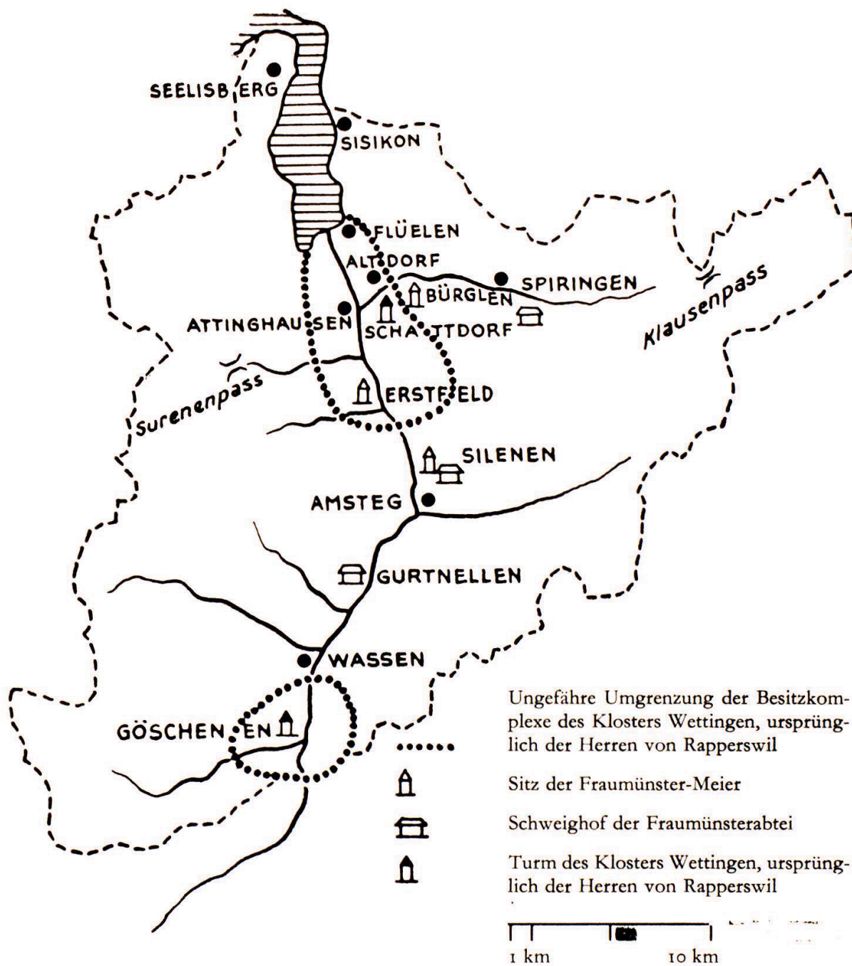
Karte 1. Mittelpunkte der Besitzungen der Fraumünsterabtei Zürich und des Klosters Wettingen im 13. bis 14. Jahrhundert.