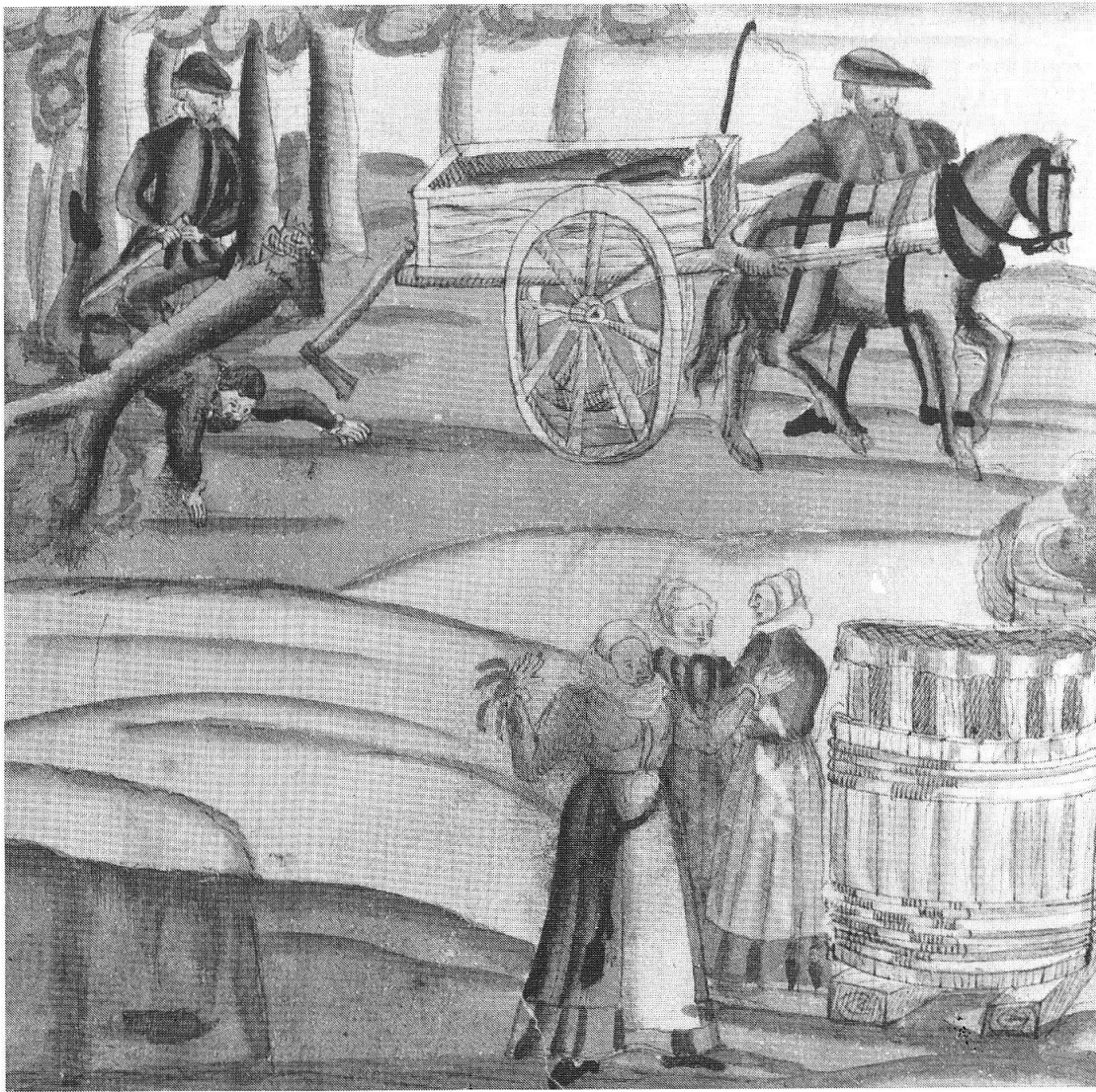
Abb. 7: Verunfallter Holzfäller, 1574. Das Fällen von Bäumen (mit der Axt) war auch im Mittelalter eine der gefährlichsten Arbeiten überhaupt. — Wickiana, F 23, 417, Handschriftenabteilung, Zentralbibliothek Zürich (Photo: ZB).