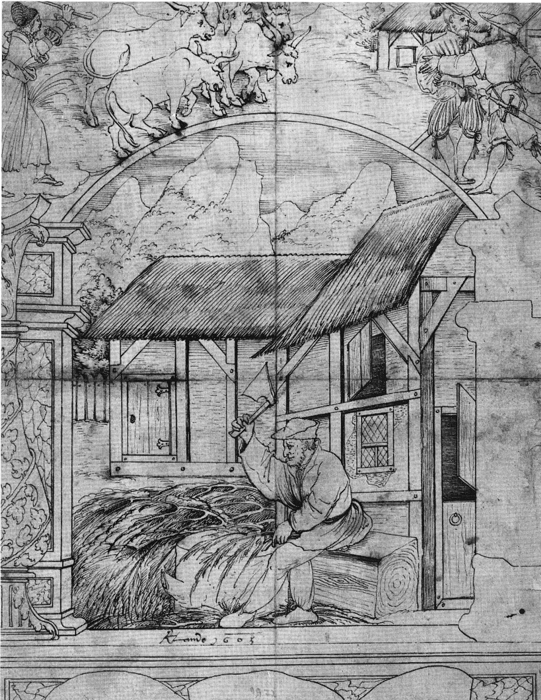
Abb. 10: Schneitelwirtschaft, zweite Hälfte des 16. Jahrhunderts: Besonders im Frühjahr, wenn der Heuvorrat aufgebraucht und das Gras noch nicht ausgetrieben war, mussten die Bauern in ihrer Not dem ausgehungerten Vieh die feineren Zweigbündel von Tannen und Fichten verfüttern. Die gröberen Äste dienen als Heizmaterial oder zum Füllen undichter Wände. Oder hackte der Bauer mit seiner Axt diese Äste zur Gewinnung von Streu in den Winterstall? — Scheibenriss eines anonymen Meisters, Schweizerisches Landesmuseum Zürich, LM 25 621.