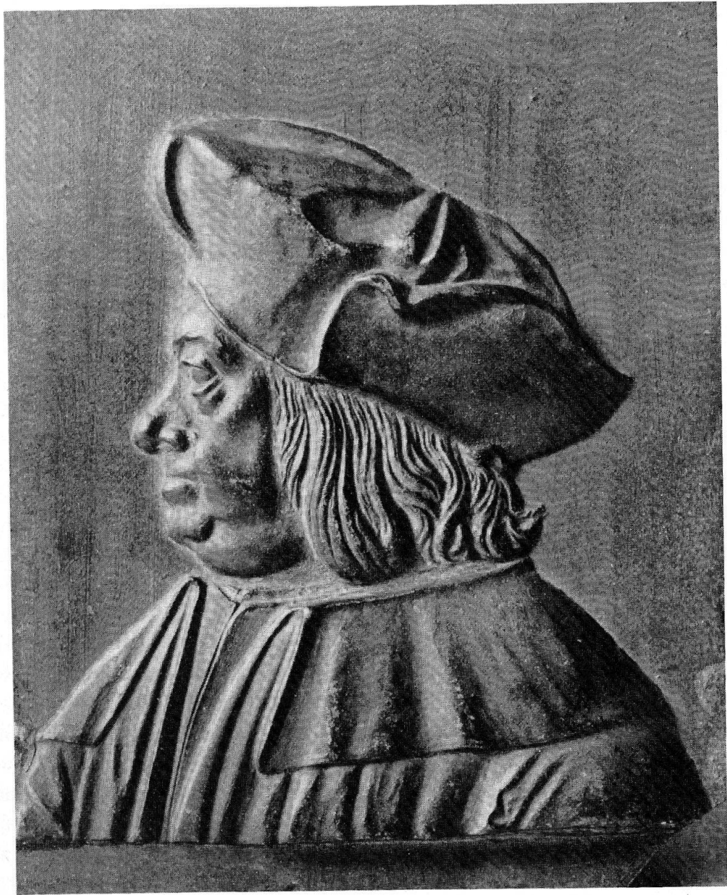
Abb. 1 Bronzeplakette mit Bildnis des Gian Giacomo Trivulzio il Magno. Schweiz. Landesmuseum. Inv. LM 25117. Höhe 19,5 cm, Breite 15,6 cm.