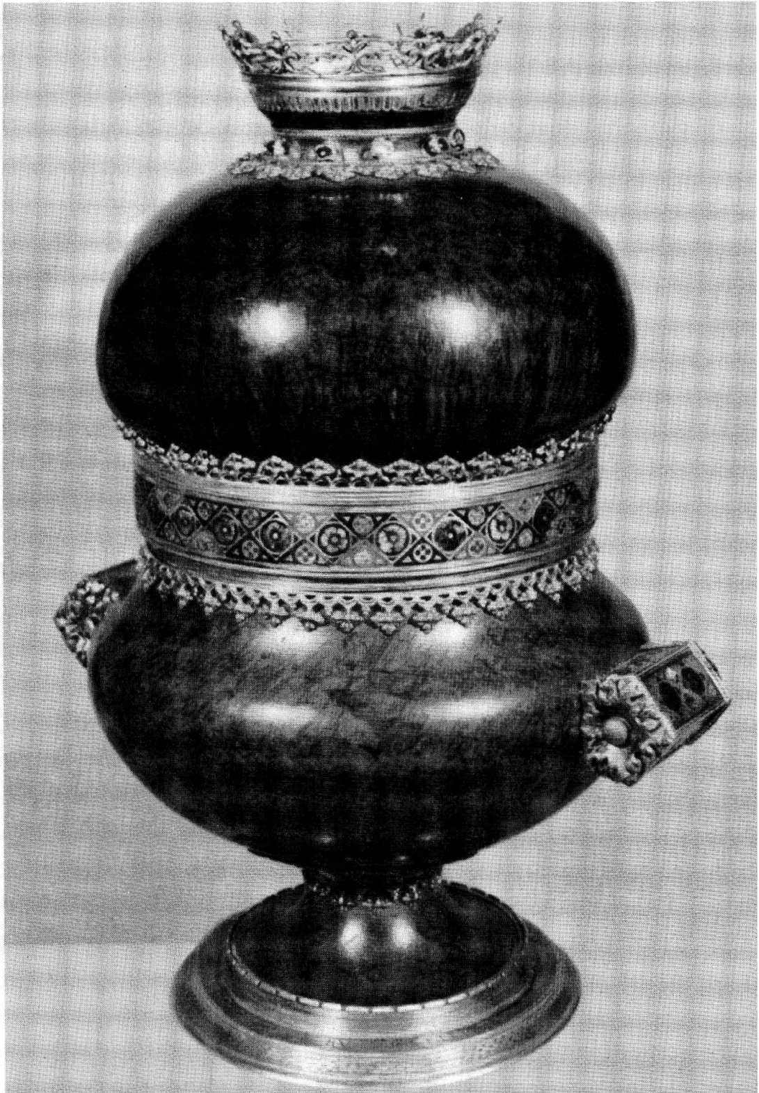
1 Der Fintansbecher von Rheinau. Gesamtansicht im heutigen Zustand. Musée de Cluny, Paris.