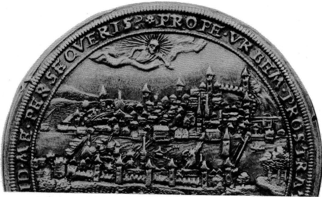
2. Ausschnitt aus der Rückseite (2½mal vergrößert).