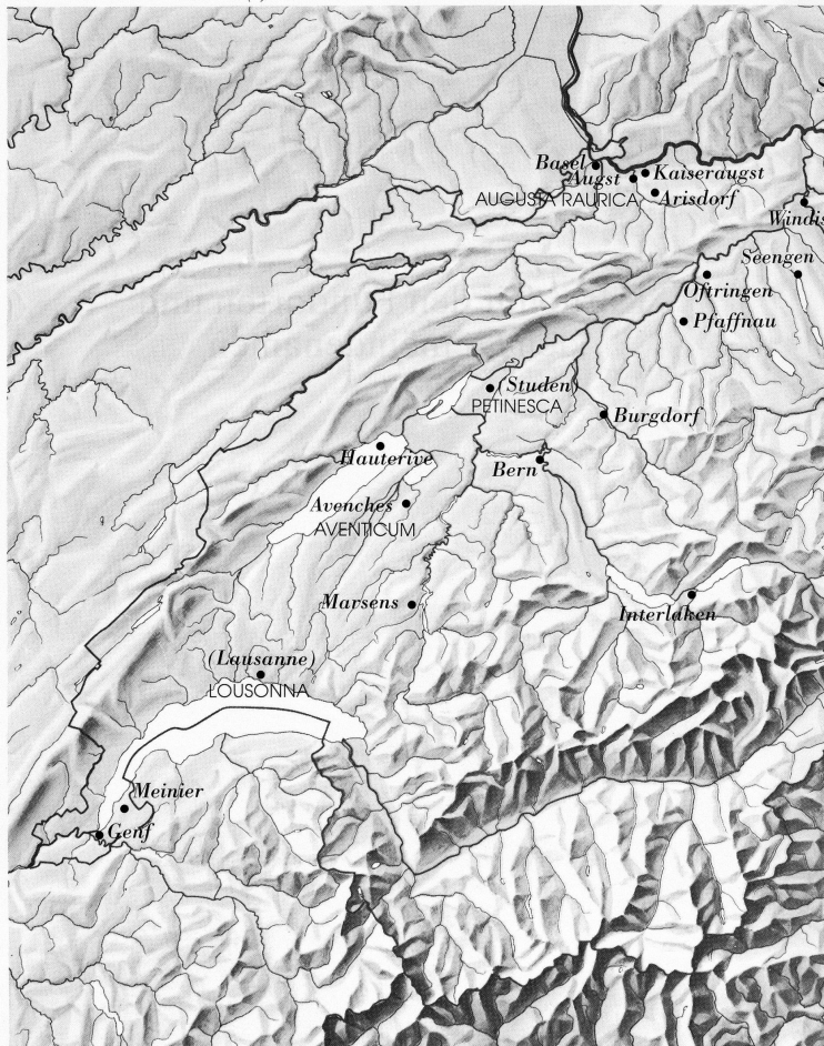
Karte mit den Fundorten (●) und den Gemeinde-Namen