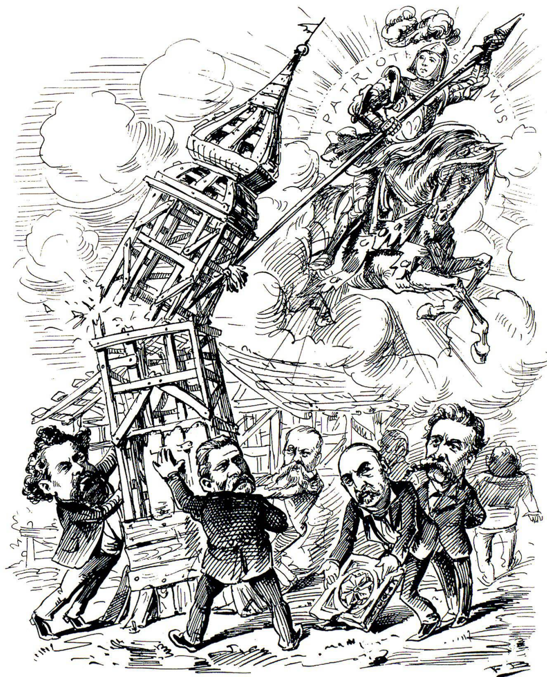
Karikatur im «Nebelspalter» vom 21. Dezember 1889. Text: «Statt des Museums wollten sie wieder etwas anderes aufrichten [den Patriotismus]; aber der Gegensatz zerstörte ihr stolzes Bauwerk.»