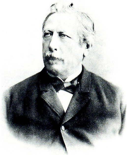
Bundesrat Karl Schenk. Bild aus der «Festgabe auf die Eröffnung des Schweizerischen Landesmuseums in Zürich».