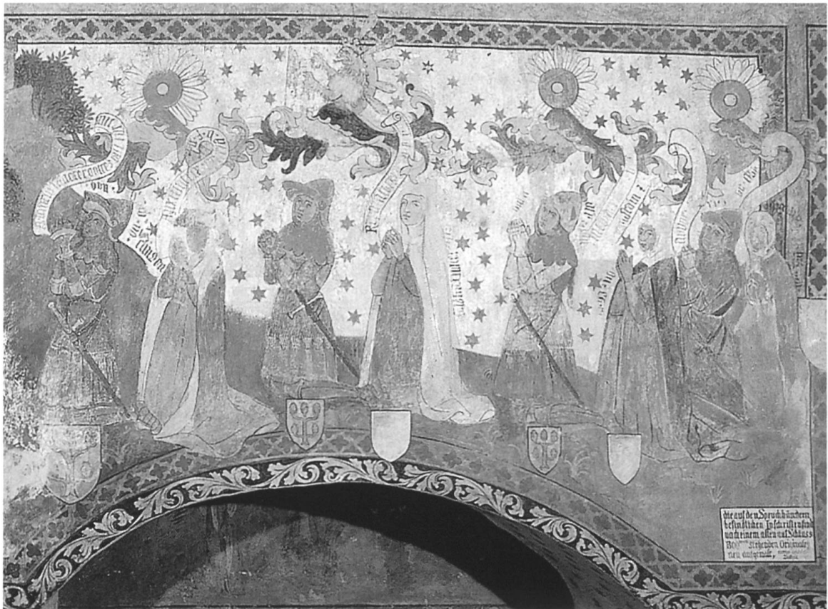
Abb. 21: Das Memorialbild der Hohenklingen in der ehemaligen Klosterkirche von Stein am Rhein (siehe auch Farbtafel). Der Anbetung der Heiligen Drei Könige wohnen vier Ehepaare von Hohenklingen (in gleicher Grösse gemalt wie die Heiligen und Maria!) bei. Das letzte Ehepaar wurde offensichtlich später zum Bild gefügt (Abstand!). Exakt unter den vorderen drei Paaren befindet sich die Grabnische.