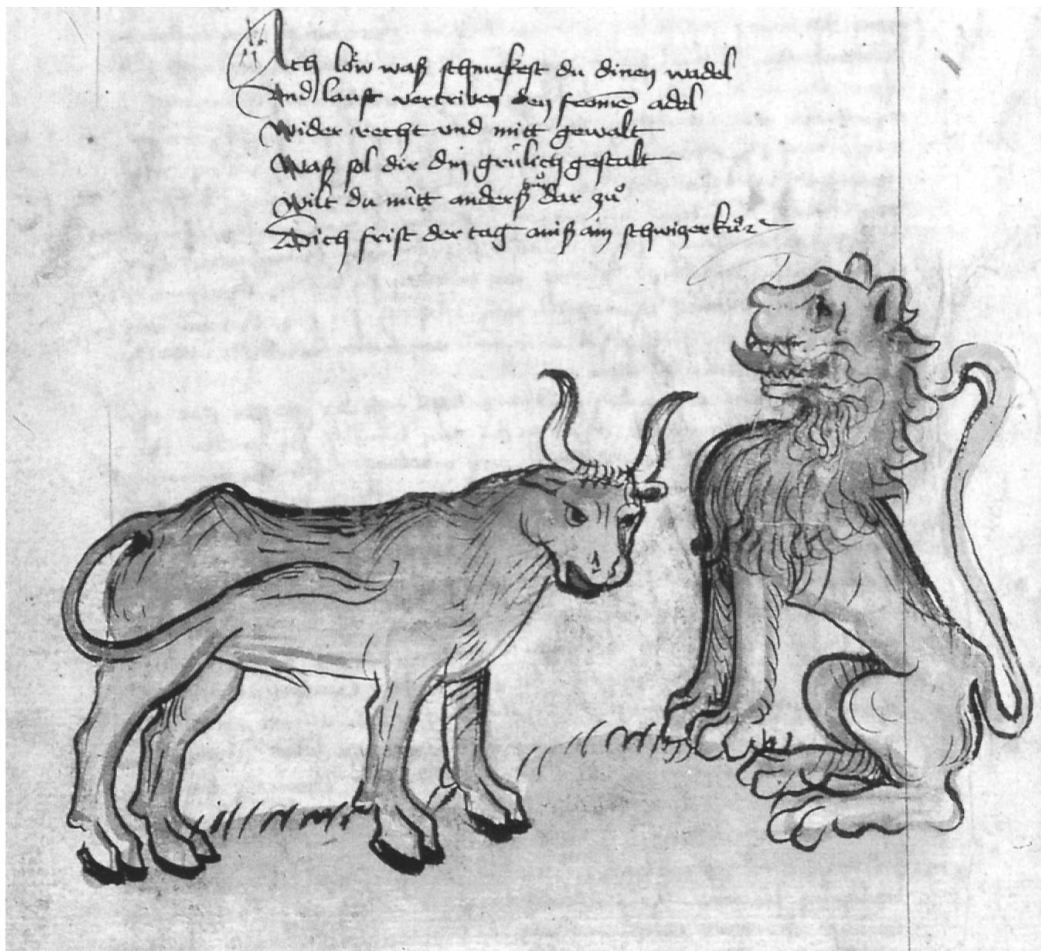
Abb. 23: Die Schweizer Kuh und der habsburgische Löwe stehen für die Mächte, zwischen denen sich der bedrängte Adel zu behaupten suchte, was die Verse über der Zeichnung ausdrücken:

«Ach löw waß schmukest du dinen wadel und laust vertriben den fromen adel wider recht und mitt gewalt waß sol dir din grülich gestalt wilt du nütt anderß tun dar zuo dich frist der tag ainß ain schwizer kuo.»