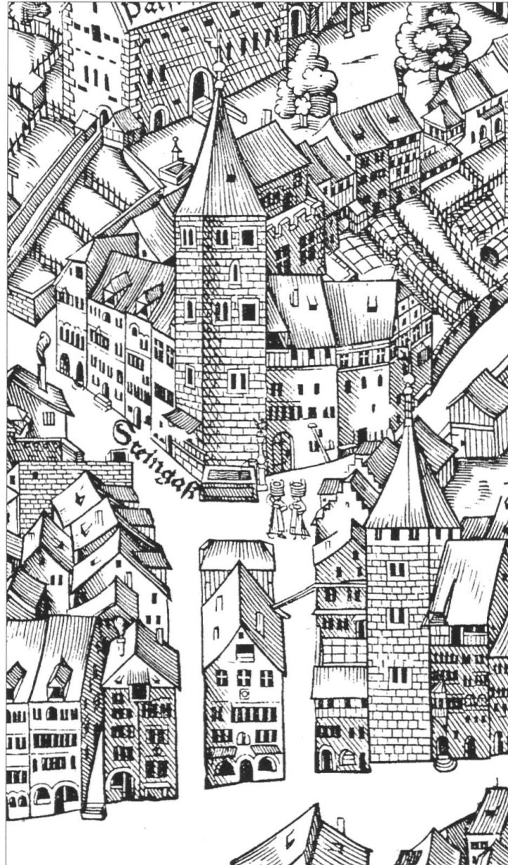
Abb. 31: «Adelstürme» in ihrem städtischen Umfeld. Oben der «Brunnenturm» am Napfplatz (Obere Zäune 26), unten der 1951 abgebrochene «Manesse-» oder «Schwendenturm» (Münstergasse 22). Die Türme sind gegenüber den Nachbarhäusern von Murer deutlich überzeichnet worden (Ausschnitt aus dem Murerplan von 1576).