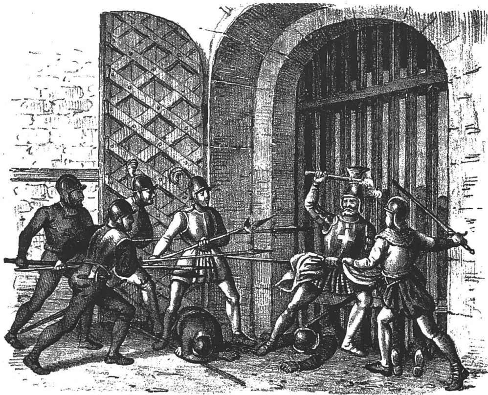
Abb. 9: Zweikampf der beiden feindlichen Protagonisten, wie er in Wirklichkeit kaum je stattgefunden hat: Rudolf Stüssi und Ital Reding. (Lithographie, um 1820/40; StASZ, Graphische Sammlung Nr. 1571)