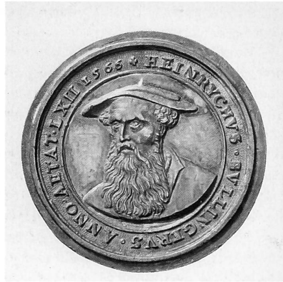
Abb. 12 und 13: Jakob Stampfer (1505/06–1579): Bildnismedaille von Bruder Klaus, um 1550/60, Silber vergoldet (Durchmesser 42,9 mm), und Bildnismedaille von Heinrich Bullinger, 1566, Silber (Durchmesser 41,5 mm: Schweizerisches Landesmuseum Zürich, LM IM 18 und LM AB 3464).

nicht die Rede, wohl aber von der Zerstörung bzw. Beschädigung anderer Zeugnisse der klösterlichen Adelsmemoria: angeblich 120 Totenschilder, die über den Adelsgräbern in der Klosterkirche hingen, wurden heruntergerissen und verbrannt, dazu in allen Gemälden das Wappen Österreichs in den «Switzer schilt» umgemalt. 88 Schliesslich sprach Ruprecht von der Zerstörung der Glasgemälde – die aber mit Blick auf den heute an der nördlichen Längsseite des Mittelschiffs vorhandenen Originalbestand aus der Zeit um 1305 nicht vollständig gewesen sein kann. 89