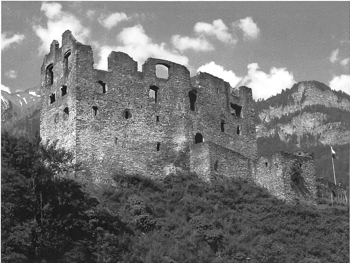
Abb. 21: Ruine Gräpplang bei Flums. Die Burg war Zentrum der chur-bischöflichen Herrschaft Flums und befand sich 1419–1470 im Pfandbesitz der Stadt Zürich. Von hier aus kontrollierte Zürich den Verkehrsweg und die Eisenschmieden in Flums und nutzte die Burg als militärischen Stützpunkt.

Adels. Territorial nicht in der Grafschaft, aber über die Schirmvogtei institutionell mit dieser verbunden war die Benediktinerabtei Pfäfers mit ihrem Grundbesitz im Taminatal, in Ragaz, Mels und Quarten. Die Gerichtsvogtei über die Pfäferser Gotteshausleute oberhalb der Saar und im Taminatal gehörte zur Herrschaft Freudenberg.