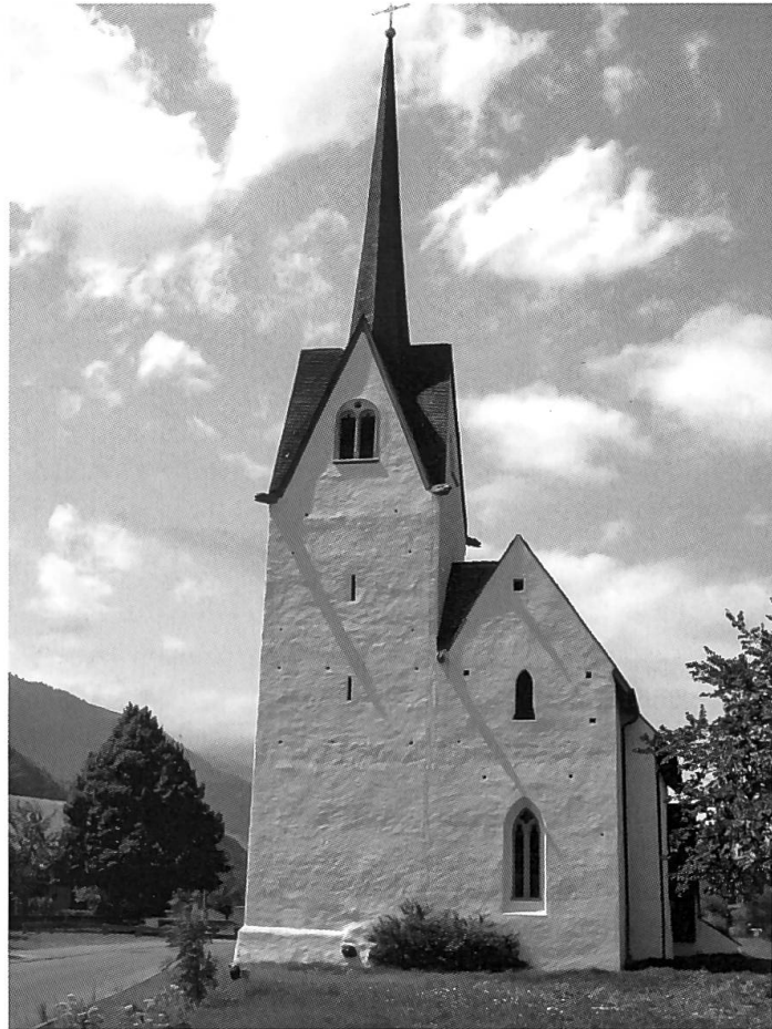
Abb. 23: Kapelle St. Leonhard bei Ragaz. Bei der um 1410 am Fusse der Burg Freudenberg errichteten Pilgerkapelle kam es am 6. März 1446 zur Schlacht bei Ragaz, dem letzten Gefecht des Alten Zürichkriegs, die mit einem Sieg der Eidgenossen über die österreichischen Truppen endete.