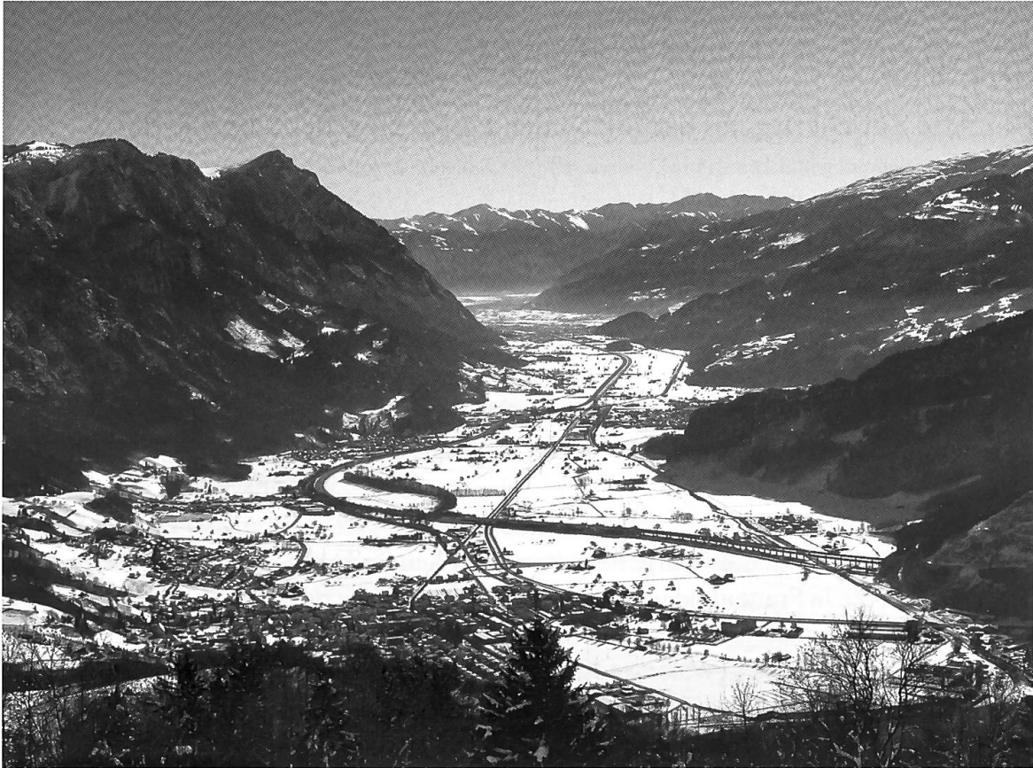
Abb. 20: Blick ins Seeztal Richtung Churer Rheintal. Unten links Walensville, rechts der Felskopf Raischiben. Die Stelle, an der heute der Autobahnviadukt aus dem Raischiben-Tunnel führt, war im Mittelalter eine natürliche Talsperre, bergwärts mit einer Letzi verstärkt. In der Bildmitte Flum und der Burghügel Gräpplang, im 15. Jahrhundert in Zürcher Besitz.

schäftigt sich mit der Schlussphase des Konflikts nach 1442, in der sich die Auseinandersetzung um das Toggenburger Erbe zum eidgenössisch-österreichischen Grosskonflikt ausdehnte und das Sarganserland zum europäischen Kriegsschauplatz werden liess. Am Schluss folgt eine Zusammenfassung, in der das Resultat des Zürichkriegs aus sarganserländischer Perspektive reflektiert wird.